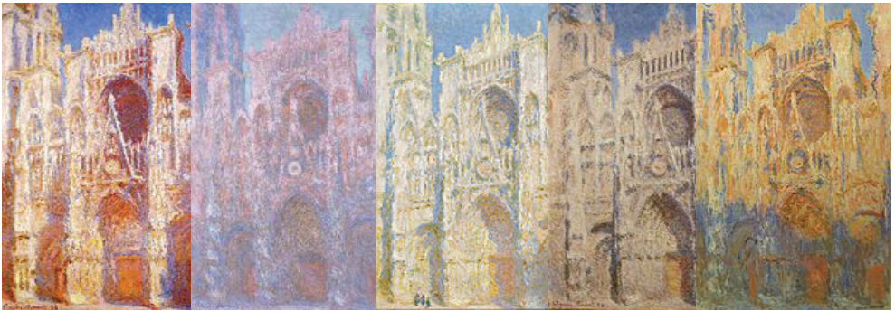
Le Portail, (soleil),1892

accède au rang de l'œuvre d'art. On peut dire que c'est après Cézanne, Monet que les conditions de perception et de constitution de l'espace sont devenues l'objet même de la peinture. Cette perception esthétique de l'espace a évolué comme le montre l'évolution de l'art contemporain. Chez Gauguin ou Van Gogh, la toile ne renvoie plus au dehors, elle ouvre sur les profondeurs du psychisme, sur la pluralité des pulsions. « L'espace qui marquait ma distance au réel est en fait la mesure de son impact sur moi » ( Encyclopédia Universalis , 1995 : 695). Claude Monet, lui cherche à saisir le temps dans l'objet, un temps lié à la vibration de la couleur et du grain. Dans la série des cathédrales de Rouen qu'il peint heure après heure, ce qui change sous les variations lumineuses, ce n'est pas uniquement la couleur de la pierre, mais toute la volumétrie. La cathédrale à tout moment redéfinit son espace.