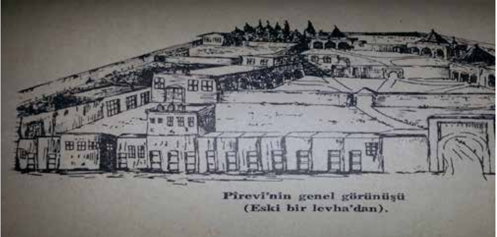
Çizim 1: Hacı Bektaş Veli Dergâhının kapatılmadan önceki halini gösteren bir levhadan kopyalanarak Bedri Noyan tarafından yapılan çizim (Noyan, 1964: 8).

Olaylara dair anılar, genellikle mekâna dair anılarla iç içe geçmiştir, bu nedenle hatırlatıcı (mnemonic) ipuçları çoğunlukla yerler, mekânlar, mekânsal göstergeler ile ilişkilidir (Meusburger vd., 2011: 7). Ya da Pierre Nora'nın ifadesini kullanarak dergâhı "hafıza mekânı" olarak adlandırmak da mümkündür. Hafıza mekânları yaşamın ve ölümün, bitimli ve bitimsiz olanın bileşimi, melez mekânlardır. Hem unutuşa engel olmak için şeyleri ölümsüzlüğe sabitler ve zamanı durdururken hem de yeni bağlantılarla eski anlamları diriltip bir yandan da yeni anlamlar üretirler (Nora, 1997: 15). Mekânsal olarak hatırlatıcı (mnemonic) ipuçlarını barındırması ya da "hafıza mekânı" olması, dergâh tarihindeki kopukluğa rağmen, dergâha dair bellekte kalan anıları canlı tutar. Bu nedenle, öncelikle "hafıza mekânı" olarak dergâhın mimarisi ve hatırlanan olayın gerçekleştiği Kırklar Meydanı hakkında bilgi vermekte fayda vardır.