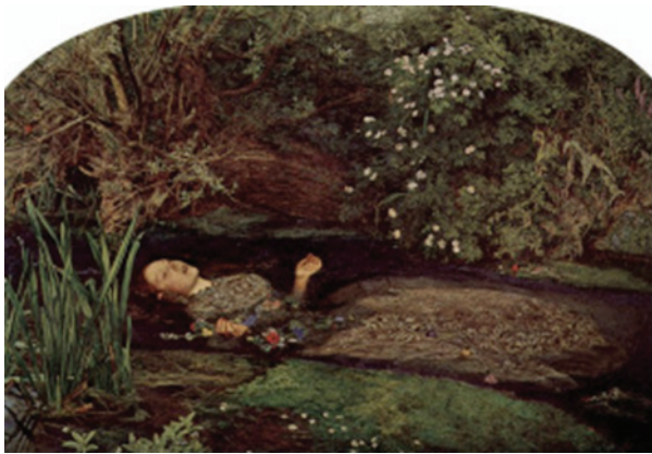
Görsel 4. John Everett Millais, 1851-1852, Ophelia 31