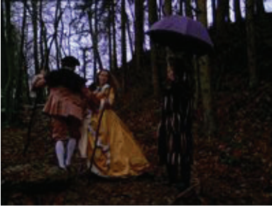
Jean-Antoine Watteau :

Pèlerinage à l'île de Cythère (Louvre, 1717)