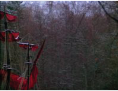
Jean-Antoine Watteau :

Pèlerinage à l'île de Cythère (Berlin, 1718)