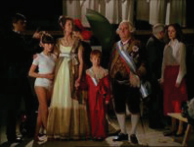
Francisco de Goya :