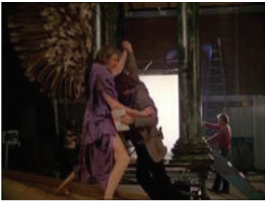
Eugène Delacroix :