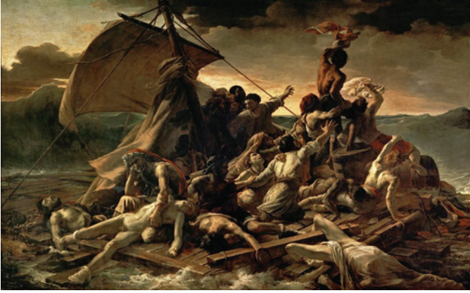
Görsel 1. Théodore Géricault, 1818-1819, le Radeau de la Méduse/Medusa'nın Salı 27