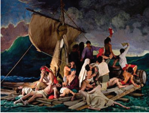
Görsel 2. Adah Hannah, 2009, The Raft of the Medusa/Medusa'nın Salı 28

Benzer biçimde, İngiliz fotoğraf sanatçısı Tom Hunter, Velasquez, Caravage, Gaugin gibi pek çok sanatçının resimlerini canlı resimler biçiminde fotoğraflarken yoksulluk, şiddet, hayat kadınlığı, konut sorunu, kenar mahallelerde yaşayan kesimlerin sorunlarını güncel taşıyor. Sıradan insanların yaşam biçimleri onun başlıca konusudur. Eski ressamların resimlerini bunun için yeniden kullanır. Resimleri olduğu gibi yinelemez; kimi zaman bir resimden bir kesiti, bir görüntüyü, imgeyi alır. Sanayileşmenin yarattığı çöküşü itilmiş