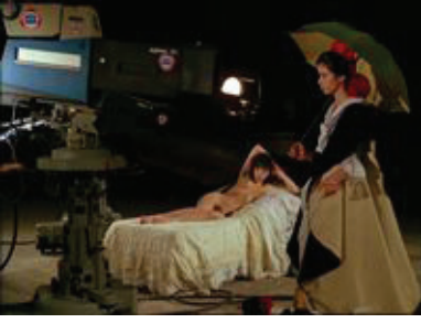
Francisco de Goya :