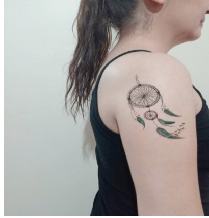
Şekil 3. Koruyucu olduğuna inanılan düş kaparı dövmesi

Kimliğin yeniden üretiminde dövme-bilişsel yönü dışa vurma aracı: Kimlik, bireyin yaşam döngüsü içinde kendine özgü ayırt edici özellikleri başkalarına karşı nasıl tanıttığı ya da başkaları tarafından nasıl algılandığıdır. Kimliğin içeriğini yaş, cinsiyet, meslek, gelir, din, etnisite gibi bireysel ve toplumsal anlamda birçok bileşen oluşturmaktadır. Birey bu bileşenler aracılığıyla bilişsel dünyasını ve varlık noktasını oluşturarak ait olduğu sosyal çevreye kendisini tanıtmaktadır (Nar, 2019). Kimliğin yeniden üretimi ise günümüz koşulları ile yakından ilişkilidir. Küreselleşme süreci ve teknolojik gelişmelerle birlikte bireyin kimliğini meydana getiren algılar, inanışlar, değerler kısa zamanda değişebilmektedir. Hatta beğenerek alınan ve kullanılan bir ürün uzun bir süre geçmeden istenmeyen bir obje olabilir. Dövme yaptırma modifikasyonu bu anlamda önemli bir örnektir. Bu anlayışa göre sahip olunan beden, alınıp satılabilen ve kullanılabilen bir mülk ve meta olarak algılanmakta ve birey daha özgür, her şeyi kontrol edebilen bilişsel bir özneye dönüşmektedir. Esasen burada bireyin sahiplik iddiasıyla beden üzerinde kontrol kurma isteği ya da göstergeler üzerinden bir gruba bağlanma isteği vardır. Ben bunu yapabiliyorum, bedenimin kontrolü bende ya da yalnız değilim aitim demeyi. Bu özelliğiyle dövme, bir gösterge olarak kimliğin yeniden inşasında/ üretiminde simgesel bir değer olarak kabul edilmektedir.