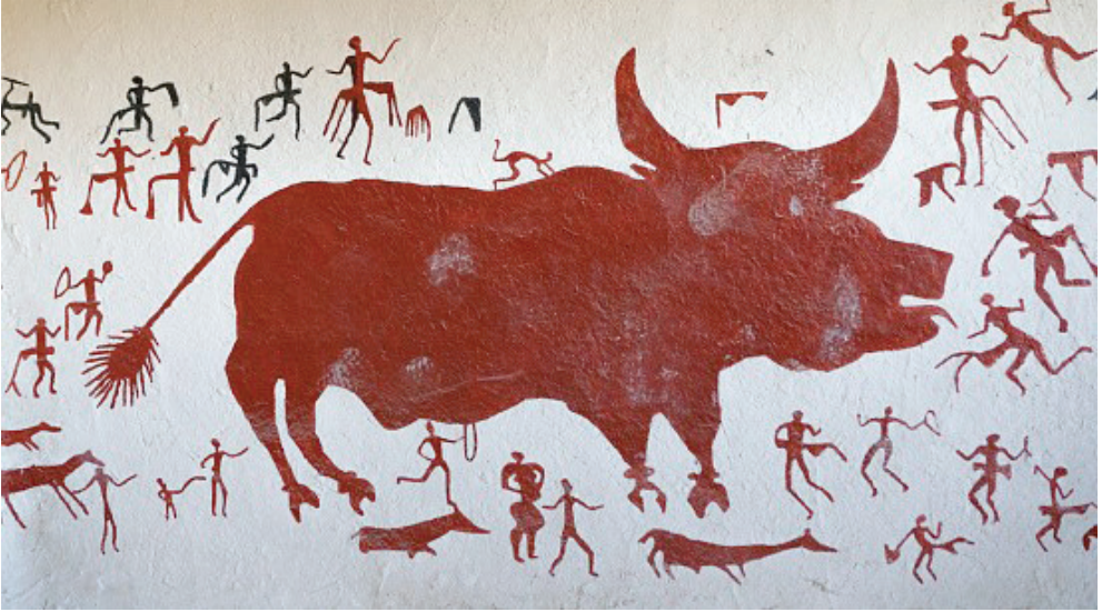
Şekil 1; Avcıların Dansı.

Anadolu'da dans ile ilgili ilk kanıtlar Konya ovasında yer alan Çatalhöyük'te görülür. Burada yapılan kazılar sonucunda ortaya çıkarılan MÖ 5800'lü yıllara ait olan "Kutsal Ev" adlı yapının duvarında "Avcıların Dansı" adlı kompozisyona ulaşılmıştır (Bkz, Şekil 1). Bu kompozisyonda elinde tef ve farklı nesnelere ile akrobatik hareketler yapan figürlere rastlanmaktadır (Zenbilci ve Çetin, 2018: 267).