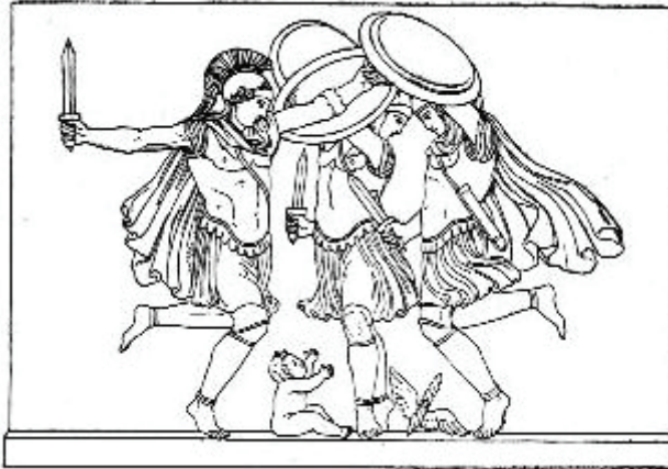
Şekil 3; Korybantlar (Kouerteler)

Kouerteler bazen Korybantlar olarak da adlandırılır. Bunlar Tanrıların annesi Kibele olarak tanımlanan Rhea'nın hizmetkârları ve büyüme günlerinde Dionysos'un koruyucularıdır. Efsaneye göre Zeus doğduğunda yamyam babası Kronos tarafından yenilmemek için Rhea (Kibele) tarafından Girit adasına götürülür. Rhea tarafından Frigya'dan çağırılan Korybantlar (kouertler) bebek Zeus'un ağladığı zaman sesi babası tarafından duyulmaması için kılıçlarını kalkanlarına vurarak dans ederlerdi (Can, 2021: 24). (Bkz. Şekil 3).