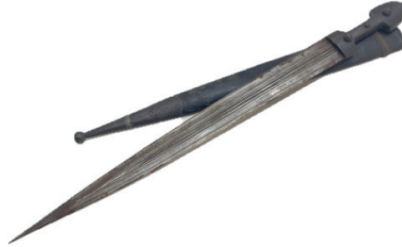
Şekil 11; Karakulak, Çerkez Kaması

Giresun ve Trabzon yörelerinde görülen horon türü bu dans, bir mücadele, kavga özelliđi taştır. Erkekler tarafından iki kişiyle ve karşılıklı biçimde sergilenir. Davul zurna veya kemençe eşliğinde müzikli olarak icra edilen bu dansa “Karakulak” denilen uzun bir bıçak ya da “Çerkez kaması” kullanılır (Köse, 2001;136). (Bkz, Şekil 11).