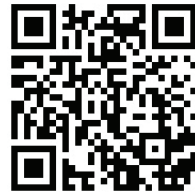
Şekil 7; Şanlıurfa Fasil Oyunu (Kılıç Kalkan).

Şanlıurfa yöresinde erkekler tarafından icra edilen bu dans, çok önceleri kılıç ve kalkan eşliğinde sergilenirdi. Ancak düğünlerde yaralanmalara sebebiyet verdiğinden dolayı kılıç kullanımı yasaklanmıştır. Bu nedenle kılıç kalkanın yerine değnek kullanılmış ve dans “Dörtlü değnek” adıyla anılmıştır. Genellikle dört kişi ile icra edilen bu dans kimi zaman altı veya sekiz kişiye kadar çıkılabilir. Dans beş bölümden oluşur. İlk dört bölümde mendilli figürler sergilenir. Bu bölümde yürüme, çökme ve kalkma gibi ayak figürleri yapılır. “Ceng-i harbi” denilen son bölümde ise dansçılar ortaya atılan değnekleri alarak savaş taklidi yaparlar. Bir süre sonra ellerindeki değnekleri yere atan dansçılar birbirleriyle kucaklaşırlar (Bkz. Şekil 7). Bu dans yiğitliği, mertliği, kardeşliği ve barışı simgeler (Kürkçüoğlu vd., 2002: 311).