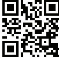
Şekil 6; Diyarbakır Şur-u Mertal.

Diyarbakır yöresine ait bu dansa yöresel düğünlerde ve eğlencelerde kılıç yerine sopa, kalkan yerine ise ayakkabı kullanılırdı. Bu yöntem daha sonraki halk dansları ekiplerinde de benzer şekilde icra edilmiştir. Ancak son dönemlerdeki icralarda kılıç ve kalkan kullanılmaya başlanmıştır. Bu dans davul zurna eşliğinde müzikli icra edilmektedir. İki kişi karşılıklı icra edildiği gibi kalabalık bir şekilde de icra edilmektedir (Bkz. Şekil 6).