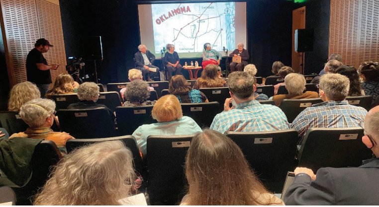
Woody Guthrie Tiyatro Merkezi'nde gerçekleşen "Bu Toprak Kimin Toprağı" başlıklı halka açık panel

Toplantının son gününde (15 Ekim Cumartesi), toplantı yeriyle ilişkili olarak özellikle de yerli Amerikalılara özel konuşmalar ağırlıktaydı. Örneğin erken sabah oturumlarından biri ( Native American Expressive Cultures ) Yerli Amerikalıların kültürel ifadeleriyle ilgiliydi. Geç sabah oturumlarından biri de "Bu Toprak Kimin Toprağı? ( This Land Is Whose Land? )" başlığını taşıyan bir paneldi. Bunu biraz açacağım: AFS Kültürel Çeşitlilik Komitesi, Yerel Planlama Komitesi ve Amerikan Müzik Arşivi sponsorluğunda gerçekleşen bu panel; toplantının düzenlendiği otelin dışında, Woody Guthrie Center Theatre'da gerçekleşti. Merkez adını ünlü "Bu toprak senin toprağın" ( This Land is Your Land ) şarkısının yazarı Woody Guthrie'den alıyor. Woody Guthrie üç binden fazla şarkının yazarı olmaktan öte bir sanatçı, aktivist 1 . Son olarak şunu da ekleyeyim, Woody Guthrie pek çok sanatçıya olduğu gibi Bob Dylan'a da ilham olmuş. Panelin Woody Guthrie'nin şarkısına atıfla bu başlık altında ve yine onun aktivist kimliğine yakışır şekilde bu toprakları savunuculuğunu yapan aktivistlerin katılımıyla yapılmış olması çok anlamlıydı. Bu son günde yerli Amerikalılara özel oturumlardan biri de "Siyah Oklahama: Geçmiş, Şimdi ve Gelecek" ( Black Oklahoma: Past, Present, and Future ) başlığını taşıyordu. Bu örneklerden sonra sanırım Amerika'nın geçmişiyle hesaplaşmasının hala bitmediğini ama öte yandan bununla yüzleşmekten de çekinmediklerini söyleyebiliriz.