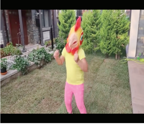
Resim 4: Chicken Song taklidi (Oyuncak Oynuyorum)

Johhny Yes Papa! şarkısındaki bir nakaratın tekrar etmesi hem de doğrudan Youtube’da yayınlanan bir videoyaya gönderme yapılması şeklinde ortaya çıktığı görülmüştür. Örneğin Öykü Oyuncak Avı kanalında, bir mutfak sahnesinde babasıyla birlikte Youtube’daki meşhur tekerleme kıvamındaki Johnny Johhny Yes Papa! şeklindeki şarkıyı diyalog şeklinde İngilizce olarak tekrar eder (OA091). Oyuncak Oynuyorum kanalında ise, Youtube’da 70.561.501 beğeni almış olan Chicken Song/ The hens’ dancing song/ 20021 isimli videonun bir benzeri çekilerek videonun aslı taklit edilmiştir (OO035).