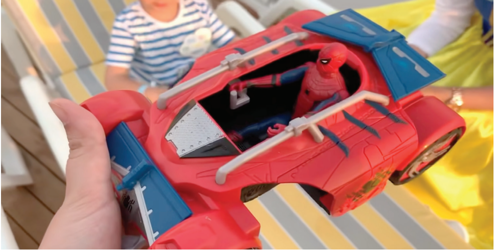
Resim 3: Örümcek Adam oyuncak arabasının ekrana yerleştirilmesi (YM053)