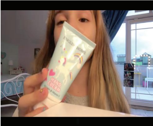
Resim 7: Ürün yerleştirme (EÇ036)