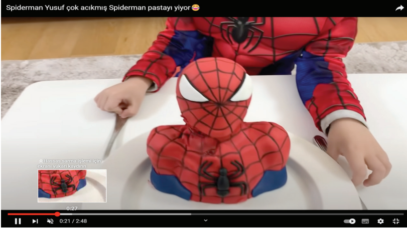
Resim 6: Yusuf Mirza ve Örümcek Adam pastışı