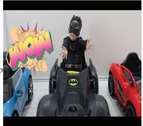
Resim 8: Ürün yerleştirme (OY099)