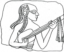
fig. 3. Terracotta from Işçali(?) in the Oriental Institute, University of Chicago, no. A. 9357; 19th-17th century B.C. Height: 5,1 cms.