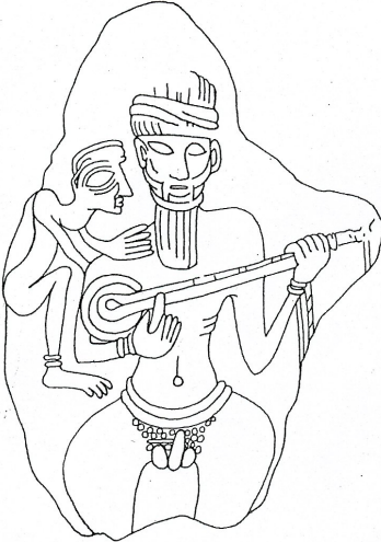
fig. 2. Terracotta from Susa in Tehran Museum; 17th-16th century B.C. (J.-L. Huot, The Ancient Civilization of Persia I [Archaeologia Mundi] Pl. 84).

Günümüzde Anadolu'da yaygın olan sazın Orta Asya'da birçok türleri vardır. Buna örnek olarak Özbek ve Türkmenlerin öteden beri kullandıkları 'dutar'; Kırgızlar'ın 'komuz'; Kazak, Karakalpak, Nogay ve Türkistan halklarının çaldıkları 'dombira' sayılabilir. Türkler Anadolu'ya gelirken kuşkusuz ki hem kopuz, hem de saz benzeri çalgılardan bazılarını beraberlerinde getirmişlerdir. Fakat Türklerin gelişinden yaklaşık 1000 yıl önce iki telli, tezene ile çalınan, orta uzunluktaki kolu üzerinde perdeleri olan, sapından püskülüne kadar bugünkü saza çok benzeyen bir çalgının Mezopotamya ve Anadolu'da yaygın olduğu biliniyor. Millattan 1300-1400 yıl önce Alaca Höyük'te taş kabartmalar üzerinde bu çalgıyı çalan kişinin sazı kemerine taktığı görülür (Layard 1984: 516).