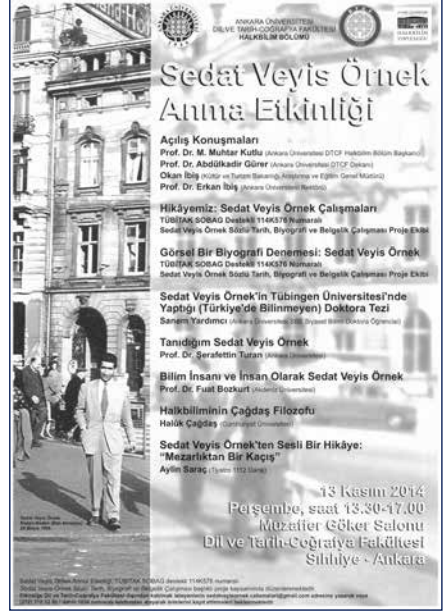
13 Kasım 2014'te düzenlenen Sedat Veyis Örnek Anma Etkinliği'nin afişi