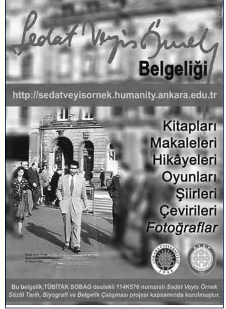
Sedat Veyis Örnek Sanal Belgeliği'nin tanıtımı için hazırlanan afiş

Sedat Veyis Örnek'in akademik dünyasında dil açısından Almanca'nın hem doktora-sını Almanya'da yaptığı için hem de Türk folkloru üzerine yazdığı metinlerde sıklıkla kullandığı Almanca kaynaklar nedeniyle çok önemli olduğunu fark ettik. Dolayısıyla Halkbilim Bölüm Kütüphanesi'nde otuz dört yıldır korunan Sedat Veyis Örnek'e ait yüz 9 tane Almanca kitabın içeriğini merak ettik. Bu nedenle hem Almanca bilgisine başvurabilmek hem alan çalışması deneyiminden yararlanarak sözlü tarih çalışmasını ortak yapmak hem de Sedat Veyis Örnek'in biyografisini yazarken birlikte çalışmak amacıyla Başkent Üniversitesi İletişim Fakültesi öğretim üyesi Doç.Dr. Günseli Bayraktutan'ı çalışma ekibimize davet ettim. Günseli Bayraktutan'la 19 Aralık 2013 tarihinde çalışmaya