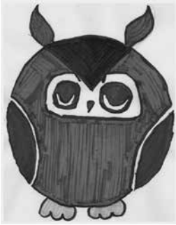
Youtube'da Kulaklı Orman Baykuşu kanalımızın logosu