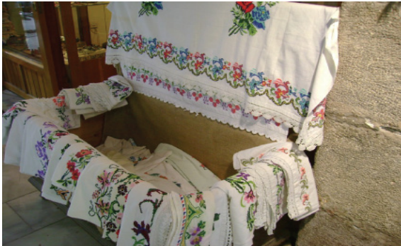
Çeyiz serme geleneği günümüzde de devam etmektedir.

Şekil 4: B Yayınevi Tarafından Hazırlanan 4. Sınıf Sosyal Bilgiler Ders Kitabı “Geçmişimi Öğreniyorum” Adlı 2. Üniteye Geçen Evlilik Geleneği İle İlgili Örnek Bir Materyal