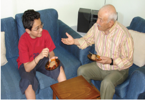
Büyüklere ve çocuklar arasındaki sevgi bağları ailede dayanışma duygusunu güçlendirir.

Şekil 5: B Yayınevi Tarafından Hazırlanan 4. Sınıf Sosyal Bilgiler Ders Kitabı “Hep Birlikte” Adlı 6. Ünite Geçen Aile Teması İle İlgili Örnek Bir Materyal