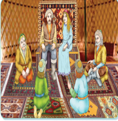
Kurultaya, boy beyleri ve hatun da katılır.

Şekil 7: A Yayınevi Tarafından Hazırlanan 6. Sınıf Sosyal Bilgiler Ders Kitabı “İpek Yolunda Türkler” Adlı 6. Ünite Geçen Aile Teması ile İlgili Örnek Bir Materyal