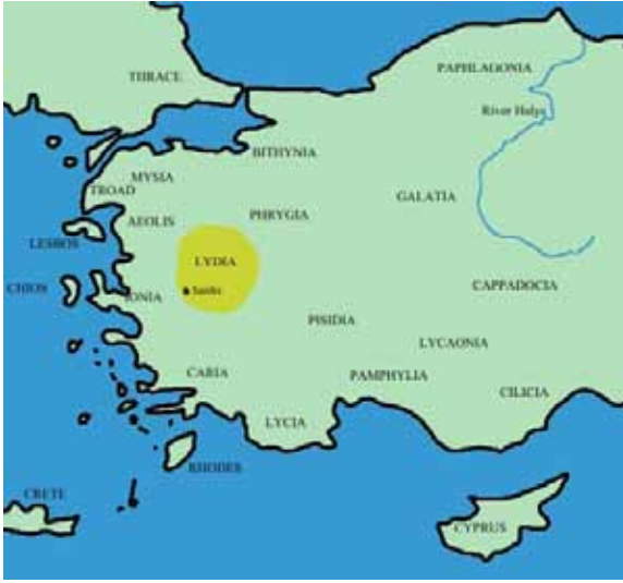
Harita 4. Lydia Devleti'nin anayurdunu işaret eden harita

Oğlu Ardys İonia'ya saldırılarına devam ederek Priene'yi almış ve Miletos'a tekrar saldırmıştır. Lydia kralları Sadyattes ve Alyattes zamanında Miletos'a akınlar devam etmiş hatta Alyattes, M.Ö. 600 yıllarında Smyrna'yı yağmalayarak kentin terk edilmesine neden olmuştur. Alyattes'in kuşatma için inşa ettiği tepenin bugün hâlâ görülebildiği bilinmektedir (Cahill, 2006, 97).