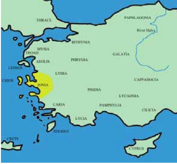
Harita 1. Ionia Bölgesinin Anadolu'daki konumunu gösteren harita.

başlamıştır (Freeman, 2003, 101). Geç dönem Yunanlıların yaşattığı bir efsaneye göre, Hellas 'taki uygarlığa, kuzeybatıdan gelen istilacı Dorlar son vermiştir. Aslında bu istilayı destekleyen çok az arkeolojik belge olduğu ve yıkımın nedenlerini daha karmaşık olaylarla açıklamak gerektiği yolunda akla yakın önermeler mevcuttur (Freeman, 2003, 101 ve 102).