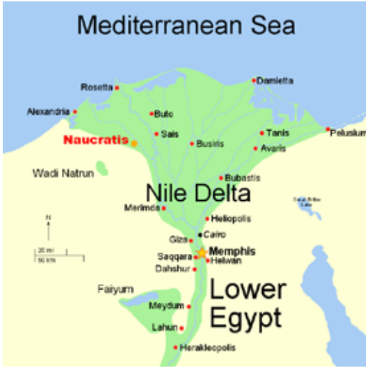
Harita 6. Nil deltası ve belli başlı merkezler

Ion kentlerinin Doğu Akdeniz'de faaliyet göstermeleri ve Karadeniz'den Mısır'a uzanan bölgelerde koloni kurabilmeleri Lydia hegemonyası altında ezilmediklerinin göstergesi olmalıdır. M.Ö. 7. yüzyılın ortalarında İonialılar Mısır'da Naukratis adında bir koloni kurdular. Aslında koloniden çok bir emporium yani ticaret merkeziydi. Helenlerin deniz aşırı yerlerde kurdukları koloniler onlar için yeni bir yurt oluyor ve bağımsız polis idealini onda da yaşıyorlardı. Ancak Naukratis, bizzat firavunun izniyle kurulan ve görece olarak onun denetiminde olan bir ticaret üssü olmaktan öteye gidemedi. Bununla birlikte Helenler bu üs aracılığıyla doğu uygarlıklarıyla çok daha iç içe hale geldiler ( Emporium 'un yeri için bkz. Harita 6).