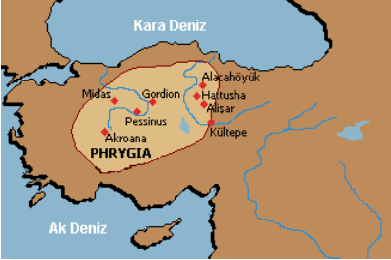
Harita 3. Phrygia Devleti'nin olası sınırlarını gösteren harita

Bununla birlikte Gordion kazılarında ortaya çıkarılan batı kökenli eserlerin hiçbiri M.Ö. 700 yıllarından daha eskiye gitmez; Batı Anadolu'daki ve Hellas 'taki Phryg eserleri de M.Ö. 8. yüzyılın son çeyreğinden daha eski değildir (Sevin, 1982b, 254–255). Phryg'lerin efsanevi kralı Midas'ın* saltanatının başlarında Anadolu'nun doğusuyla meşgul olduğunu ve Asur kralıyla çatışmaya girdiğini ve sonunda Asur kralıyla antlaşma yaptığını Asur kralı belgelerinden biliyoruz. Bu antlaşmadan sonra Midas'ın yüzünü batıya çevirdiği arkeolojik belgelerle de doğrulanmış oluyor.