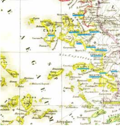
Harita 2. Smyrna ve adalar dâhil olmak üzere on üç Ion polisinin yerini gösteren harita. Konumları altı çizilerle belirtilmiştir.

Kuzey Ege'de ve güneybatı Anadolu'da olduğu gibi dağlar kıyı bölgelere ulaşımı imkânsız kılmamış, bilakis Gediz ve Büyük Menderes ırmak vadileri sayesinde iç bölgelerle, Anadolu'daki diğer devletlerle rahatça ilişki kurmuştur Ionia ve deniz kıyısında olmanın kazanımları da Ionia polislerini Eski Yakındoğu'nun diğer devletleriyle tanıştırmıştır.