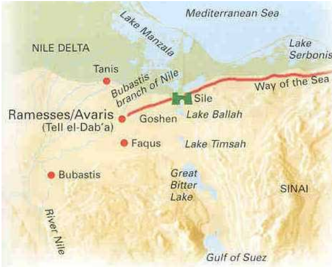
Harita 7. Herodotos'un anlatımına göre Mısır firavunu I. Psammetikos tarafından Ionialı lara ve Karialı lara verilen toprakların harita üzerindeki konumu

Herodotos bu olayı şöyle aktarmaktadır: “Kendisine yardım eden Ionialı larla Karialı lara, Psammetikos Nil'in iki geçesinde sıralanmış, birbiri karşısına düşen ve Nil'le ayrılan topraklar verdi (Bkz. Harita 7). Bunlara, “kamplar” adı verilmiştir. Bu topraklardan gayri, daha ne söz vermişse hepsini yerine getirdi. Onlara Mısırlı çocukları emanet etti, Yunan dilini öğrensinler diye; bugün Mısır'da bulunan tercümanlar, o zaman Yunan dilini öğrenmiş olan bu çocukların torunlarıdır. Onlara verilen yerler Nil'in Pelusion ağzı üzerindeki Bubastis'in az aşağısına düşer ve deniz kıyısıdır, Ionialı lar ve Karialı lar burada uzun süre oturmuşlardır. Sonradan Kral Amasis* onları buradan Memphis'e aldırmuş ve Mısırlılara karşı kendisini korumak için bunlardan bir birlik kurmuştur. Onların Mısır'a yerleşmiş olmaları sayesinde ki, onlarla ilişki kurmuş olan biz öbür Yunanlılar, kral Psammetikos zamanında ve ondan sonra gelen krallar zamanında Mısır'da neler olup bittiğini tam tamına öğrenebiliyoruz; gerçekten bunlar, başka dil konuşup da Mısır'a girebilen ilk halktırlar. Sonradan ayrıldıkları topraklar ben oradan geçtiğimde gene o halleriyle duruyorlardı, gemilerini karaya çektikleri yerler ve evlerinin yıkıntıları belliydi” (II. 154).