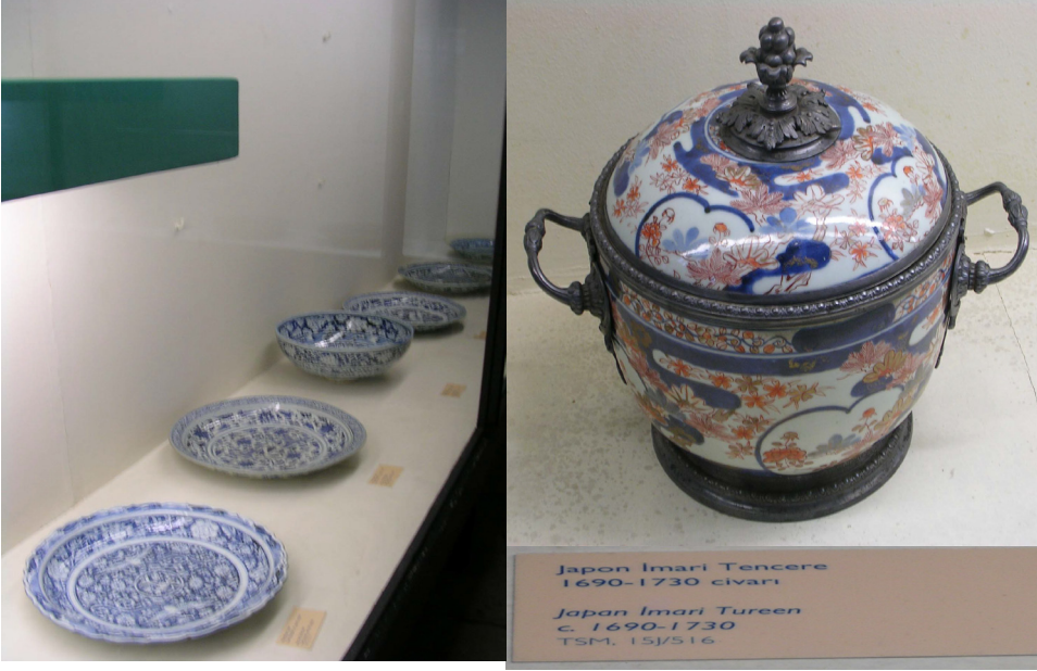
Japon Porselenleri (Çin ve Japon Porselenleri Odası) Topkapı Sarayı