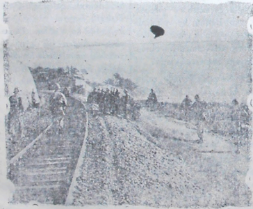
İkinci defa Komünistlerin eline geçen Seul'ü tahliye eden Birleşmiş Milletler kuvvetleri Seul'ün güneyinde yeni müdafaa hatlarına çekiliyorlar.

"Rusyanın üçüncü dünya harbini açmaya hazır olmadığına kanım, hiç kimse ciddi surette düşünmeden diyebilir. Rusyanın üçüncü dünya harbini açmaya hazır olmadığına kanım, hiç kimse ciddi surette düşünmeden diyebilir. Rusyanın üçüncü dünya harbini açmaya hazır olmadığına kanım, hiç kimse ciddi surette düşünmeden diyebilir."