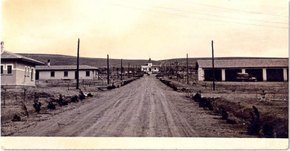
3. Atatürk Orman Çiftliği, 1927 (Cangır, 2007)

1926 tarihli Mustafa Kemal Paşa Hazretlerinin Ankara Çiftlikleri adlı yayında, binaların alan içinde simetrik olarak yerleştirilmelerine özen gösterildiği, yapımlarında beton ve tuğla kullanıldığı, elektrikle aydınlatıldıkları belirtilmiştir. Binaların konumları ise şöyledir: