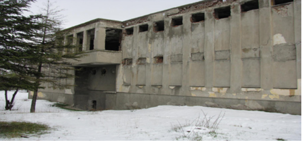
15. Bira Fabrikası Hamamı, Batı Cephe

Edelputz sıva ile kaplı bütün cepheler geniş olmayan bir saçak silmesi ile sonlanır. Yapı, dönemim malzeme-teknik kullanımına uygun olarak betonarme iskelet sistemine sahiptir. Geleneksel hamamlardan farklı olarak, ocak sistemi yerine, bodrum katındaki kalorifer sistemi ile ısıtılan yapının soyunmalık ve ılıklik bölümlerinde kalorifer peteklerinin yerleri günümüzde görülmektedir. Sıcaklık ise geleneksel hamamlarla benzer anlayışla zemininden ve duvarlarından geçen sıcak su boruları ile ısıtılmıştır. Mekanların zemin kaplamasında mermer ve seramik kullanılmıştır. Yapıda bu dönemin modern mimarlık anlayışına uygun olarak herhangi bir bezeme ögesi bulunmamaktadır.