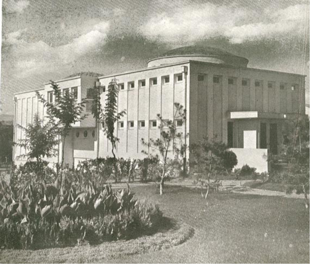
5. Bira Fabrikası Hamamı (Anonim 1939)

Ernst Egli, Bira Fabrikası Hamamı tasarımında genel olarak Osmanlı hamamının bu karakteristik şemasına bağlı kalmakla birlikte, malzeme-teknik kullanımında 1930'lu yılların Uluslararası Mimarlık anlayışına uymuş, su ve ısıtma sisteminde geleneksel hamamlardan farklı olarak teknolojinin olanaklarından yararlanmışır. (Foto.5)