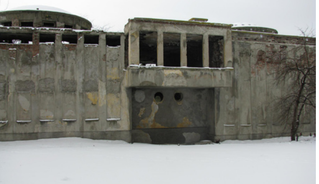
16. Bira Fabrikası Hamamı, Doğu Cephe

Edelputz sıva ile kaplı bütün cepheler geniş olmayan bir saçak silmesi ile sonlanır. Yapı, dönemim malzeme-teknik kullanımına uygun olarak betonarme iskelet sistemine sahiptir. Geleneksel hamamlardan farklı olarak, ocak sistemi yerine, bodrum katındaki kalorifer sistemi ile ısıtılan yapının soyunmalık ve ılıklik bölümlerinde kalorifer peteklerinin yerleri günümüzde görülmektedir. Sıcaklık ise geleneksel hamamlarla benzer anlayışla zemininden ve duvarlarından geçen sıcak su boruları ile ısıtılmıştır. Mekanların zemin kaplamasında mermer ve seramik kullanılmıştır. Yapıda bu dönemin modern mimarlık anlayışına uygun olarak herhangi bir bezeme ögesi bulunmamaktadır.