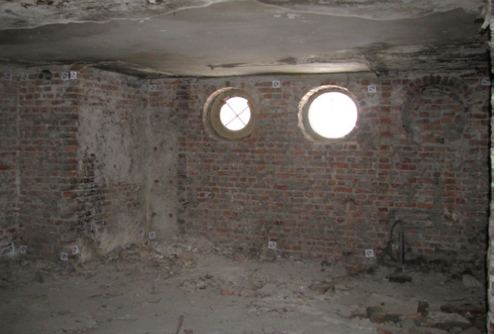
10. Bira Fabrikası Hamamı, Ilıklık