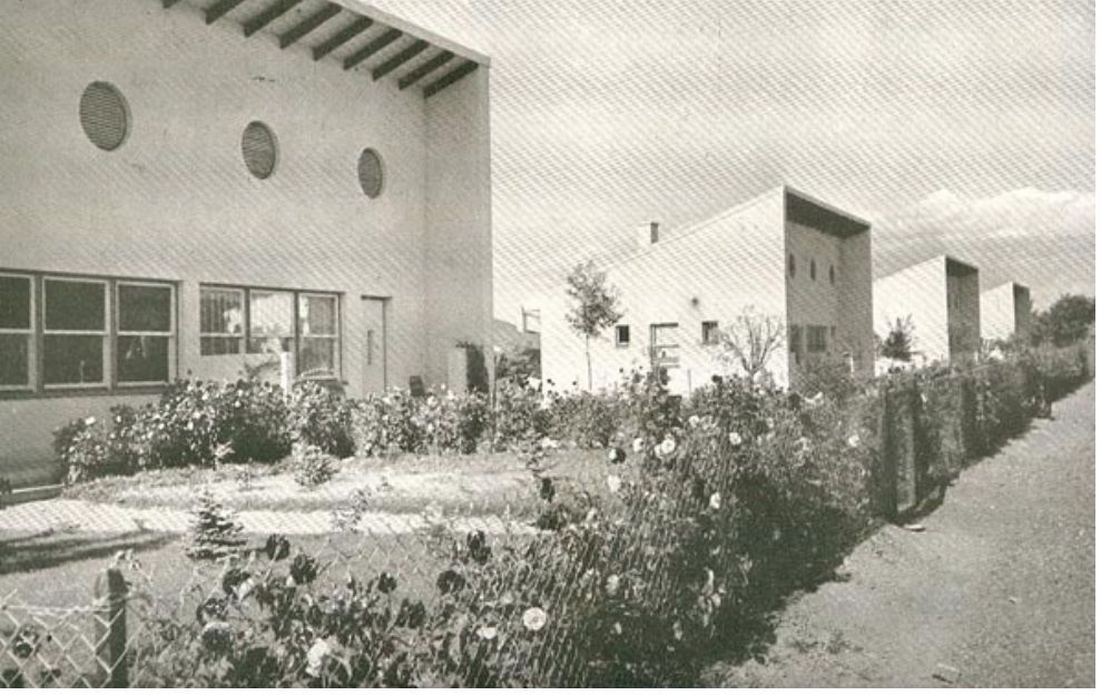
17. Bira Fabrikası Konutları (Anonim 1939)

Yerleşkedeki merkezi konumu ve mimari özellikleri ile farklı anlamlar yüklenebilecek hamam yapısının bütün bu özellikleri ile, her ayrıntısı düşünülerek işlevin ve malzemenin öne çıkarıldığı, geleneksel hamam tipolojisi ile modern malzeme ve tekniğin birlikte kullanıldığı bir sentez yapısı olduğu görülmektedir.