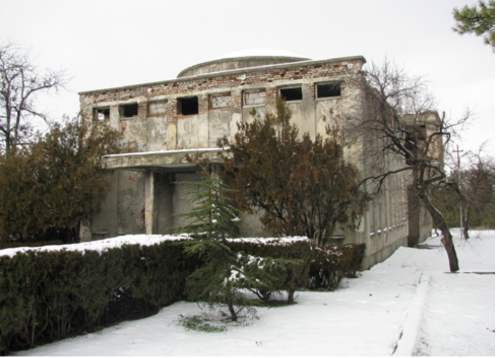
14. Bira Fabrikası Hamamı, Güney Cephe

kasnağındaki yatay dikdörtgen pencereler görülür. Yapının kuzey cephesi ise arkasındaki sıcaklık bölümünün işlevine uygun olarak sağır bırakılmış, yüzeysel düşey girintilerle hareketlendirilmiştir.