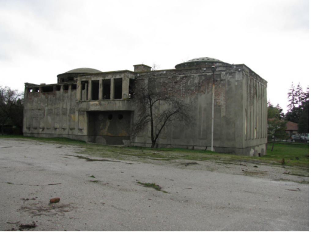
8. Bira Fabrikası Hamamı, 2010

yerleşkedeki konut sıkıntısının da etkisi ile atıl durumdaki yapının bir bölümünü bir memur ailesi konut olarak kullanmıştır. Yapıldığı dönemde, diğer fabrika yerleşkelerinde olduğu gibi, Bira Fabrikası çalışanlarının, iş paydosu verildikten sonra, kaldığı işçi pavyonuna ya da evine gitmeden öce temizlik gereksinimini karşılama amacına hizmet vermektedir.