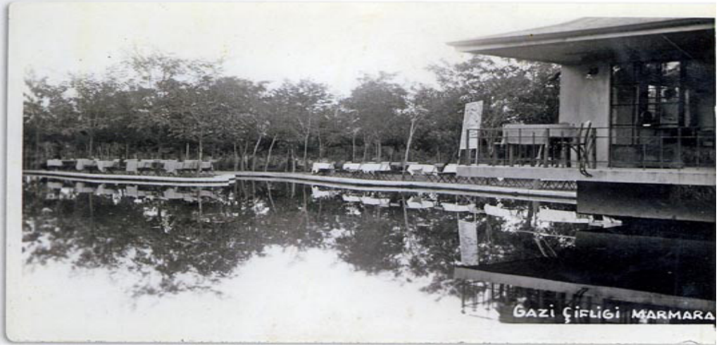
2. Atatürk Orman Çiftliği, Marmara Havuzu, 1930'lar (Cangır 2007)