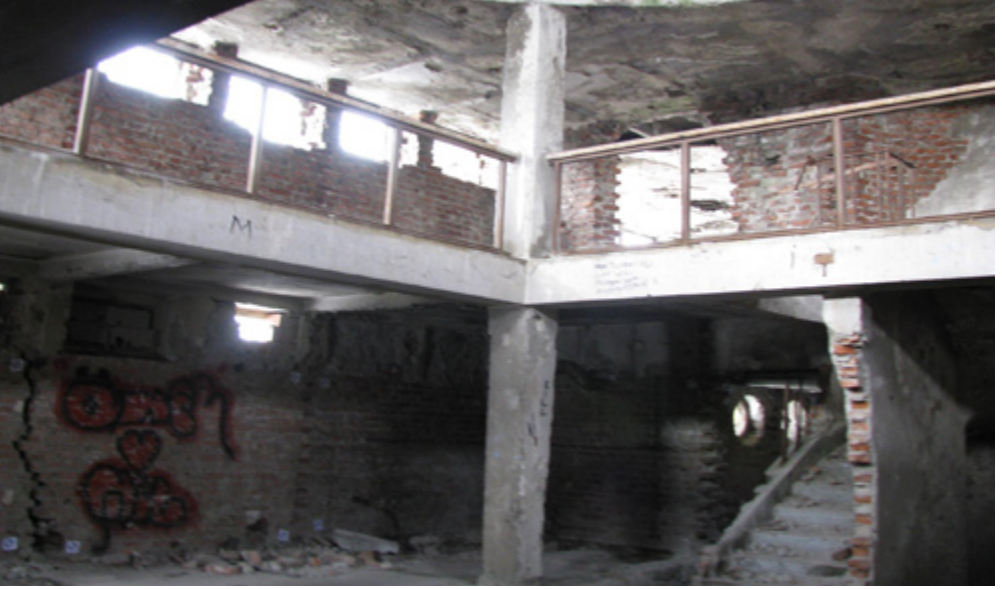
9. Bira Fabrikası Hamamı, Soyunmalık

karşılıklı beşer soyunma odası ile kuzeyindeki kapının iki yanında kare biçimli, diğerlerinden daha büyük birer oda olduğu görülmektedir. Mevcut izlerden ahşap bölüntüler halinde olduğu anlaşılan bu odalar günümüze ulaşmamış, pencereler ise sonradan kapatılmıştır. Mekanda bulunan malzeme parçaları, zemininin mermer kaplı olduğunu ve kalorifer sistemi ile ısıtıldığını göstermektedir.