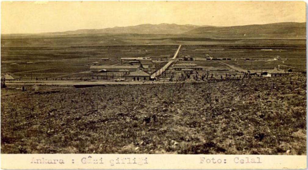
1. Atatürk Orman Çiftliği Merkezi, Genel Görünüm, 1927 (Cangır 2007).

Atatürk Orman Çiftliği, tarımın, endüstrinin ve ticaretin yapıldığı, aynı zamanda halka açık eğlenme, dinlenme ve piknik alanlarının bulunduğu örnek bir kamusal mekan yaratma isteğinin sonucu olarak, devlet girişimi ile 5 Mayıs 1925 tarihinde “Gazi Orman Çiftliği” adı ile kurulur ( Foto.1 ).