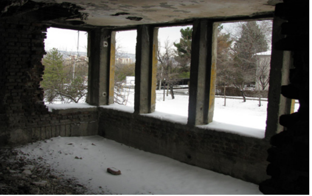
13. Bira Fabrikası Hamamı, Kafeterya

Soyunmalık bölümünün zemine açılan galeri katı, zemin katta olduğu gibi günümüzde ancak izleri görülebilen eş büyüklükte soyunma odalarını barındırır. Boydan boya demir korkuluk ile kuşatılan galeri katının doğu, batı ve güneyinde, yine üst seviyede olmak üzere sekizer pencere sıralanır. Galerinin kuzeyindeki iki kapıdan, ılıklığın üst katındaki kafeteryaya geçilir ( Foto 14 ). Geleneksel hamamda olmayan bu ilginç mekan, geçmişte soyunmalık bölümünde yapılan yeme içme, sohbet ve dinlenme işlevini karşıladığı anlaşılmaktadır. Doğu-batı doğrultusunda dikdörtgen biçimli mekanın ortasında kafeterya işlevine ilişkin bir bölme bulunduğu yine izlerden ve özgün plandan anlaşılmaktadır. Bu mekan, hamamın diğer mekanlarından farklı bir anlayışla, işlevine uygun olarak doğu ve batısındaki düşey dikdörtgen pencerelerden bol ışık alır. Yapının üç ana bölümden oluşan bodrum katı ise su ve ısıtma sistemini barındırmaktadır.