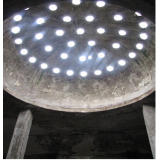
12. Bira Fabrikası Hamamı, Sıcaklık

Ilıklığın kuzeyindeki kapıdan ulaşılan sıcaklık, hamamın en büyük mekanıdır. (Foto 12,13) . Ortasındaki dört kolonun taşıdığı kubbe ile örtülüdür. İşlevine uygun olarak bütün duvarları sağır bırakılan mekan kubbe yüzeyindeki 44 fil gözünden ışık alır. Zemini soyunmalık ve ılıklıktan biraz daha alt seviyede olan sıcaklık, 15 cm yükseklikteki seki ile dört yönden kuşatılmıştır. Su olukları, seki boyunca devam eder. Mekanın ortasında daire biçimli göbek taşı bulunur. Zeminden yüksek bu betonarme platformun dört tarafından bodrum kattaki ısıtma sistemi ile bağlantı sağlanmıştır. Duvarlarda bulunan nişlerden üst seviyedekiler havalandırma ve buhar dolaşımını sağlayan sistemi barındırır. Alt seviyede ise su sistemi ve eşit aralıklarla yerleştirilmiş kurnaların izleri görülür. Günümüze ulaşan parçalardan mekanın zemin kaplamasında soyunmalık zemininde olduğu gibi mermer kullanıldığı anlaşılmaktadır.