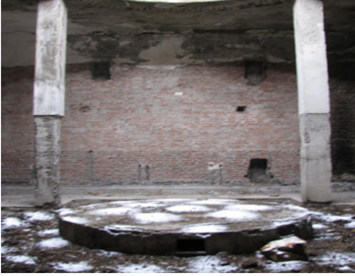
11. Bira Fabrikası Hamamı, Sıcaklık

Giriş eksenindeki kapıdan ulaşılan ılıklik, soyunmalık ve sıcaklık arasında geçiş mekanı niteliğindedir. (Foto. 11) Özgününde üç köşesinde birer halvet, dördüncü köşede ise tuvaletler ile doğu ve batısında dörder yuvarlak pencere yer alır. Bu bölümün zemininde bulunan kare kaplama malzemelerine ait parçalardan zemin kaplamasında, diğer iki ana mekandan farklı olarak, yine bu dönemde yaygın olan seramik kullanıldığı anlaşılmaktadır.