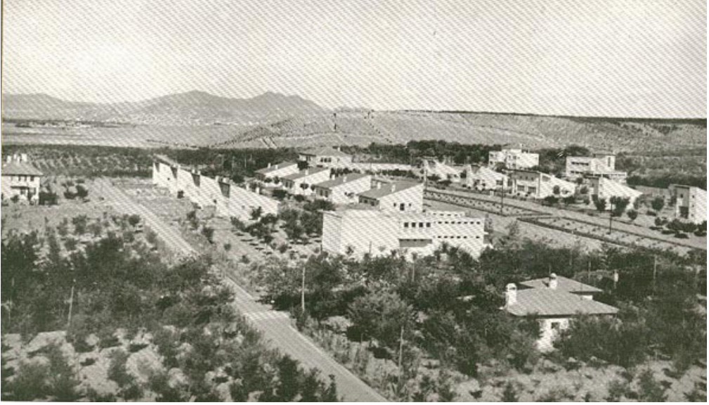
6. Bira Fabrikası Hamamı ve Konutlar, Genel Görünüm (Anonim 1939)

alınan teknik yardım doğrultusunda fabrikanın kuruluşunu gerçekleştirir. 1937 yılına gelindiğinde, mevcut bira fabrikasının yetersiz olduğu gerekçesi ile yeni bir fabrika ve bununla birlikte hamam ve amele evlerinin yapılma kararı alınmış ve bu karar aynı yıl uygulanmıştır.*