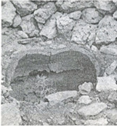
Fotoğraf 6. Midyat Yezidi Oyuklu(Taka) köyünde ocağı sönen bir ailenin tandırı.