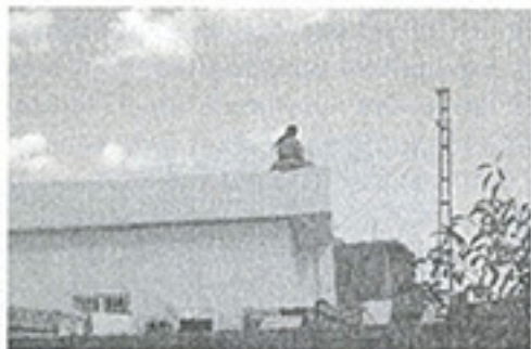
Fotoğraf 12. Yeni evlerinin damında vadinin derinliklerine bakan bir Yezidi kadını (Almanya'dan yaz mevsimi için gelen aile).

olan lentoyla geçilmiştir. Bu da kırsal köy yerleşmelerinin çok eski tarihlere dayandığını göstermektedir. Yapı tekniğine ve geleneklerine duyulan bağlılıktan dolayı Yezidiler son yıllarda yapılan konutların yapım tekniğinde bir değişikliğe gitmemişlerdir.