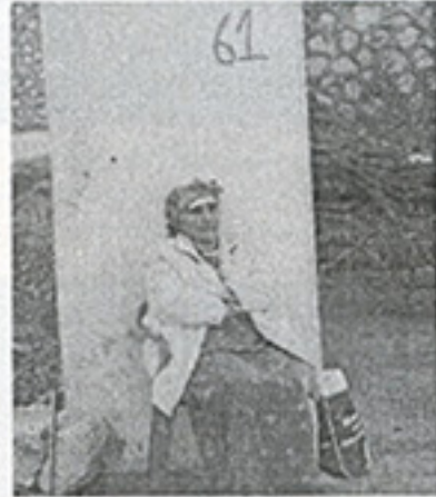
Fotoğraf 11. Almanya'da yaşayan ve yazları Kefnas'a gelen kanser hastası Yezidi bir kadın.

Evlerin tavanları basık tonozlarla geçilmiştir. Mardin'in ilk dönem evlerinde olduğu gibi Yezidi evlerindeki kapı ve pencerelerin açıklıkları kemerle değil, tek taş