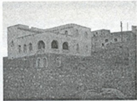
Fotoğraf 9. Yurtdışında kalan bir Yezidi ailesinin yaptığı yeni konut. (Graf: K. Sami; 2008)

Yezidi sözlü kültür geleneği sadece büyük bir çeşitlilik göstermekle kalmayıp, aynı zamanda duygusal bir tınısı hayli fazla olan folklorik alanın bir parçasını da oluşturmaktadır. Yezidiler; Mezopotamya bölgesel kültürel sürecinin bir parçası olmakla beraber; kendilerine özgü birtakım kaygıları özlerinde hep taşımışlardır (Allison, 2007, s.9-10). Gelenekselliklerini yüzyıllar boyu gerçeğine yakın bir şekilde koruyabilmiş bu halk; 1980'lerden sonra toplumsal yaşamı idame eden geleneksel kabullerin erozyona uğradığı dönemler olarak bilinmektedir (Çetin, 2005, s.74). Yezidiler; yerleşmek amacıyla bir yeri seçerken birçok etmeni bir arada düşünmek zorunda kalmışlardır. Ekonomi, doğal çevre, sosyal yapı, aşiret, din ve dil gibi etmenler temel belirleyiciler olarak alınmıştır. Ovalarda yer alan yerleşmeler; orta yükseklikte dört duvar ile çevrilmiş evlerin düzensiz olarak bir arada kümelenmesiyle dikkat çekmektedir. Ancak çevre baskısından ürken Yezidiler; çok eski zamanlardan beri homojen olarak bir arada olmalarını sağlayan köy yerleşimlerini tercih etmişlerdir.