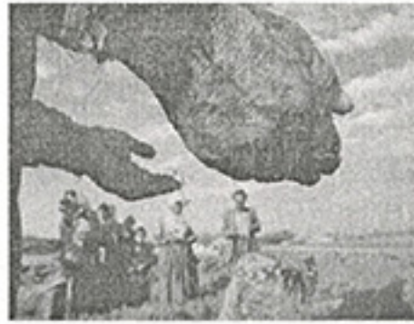
Fotoğraf-2. Beşiri-Hamduna(Kurukavak) köyünde akşam duasını yapan bir grup Yezidi. Viranşehir-Burç köyünde bir mezarın başında dua eden Yezidiler. (Graf: A.F. Pınar; 2000)

Mezopotamya uygarlığının yarattığı çoğulcu kültür deseni içerisinde; Yezidiler farklı bir inancın ve kültürün aidiyetini taşımaktadırlar (1-2). Bu halkın farklı olan dini inancı; tarihin her döneminde araştırmacıların odak noktası olmasına karşın, kırsal yerleşim örüntülerinin sahip olduğu geleneksel yapıyı oluşturan düşüncenin kabul değerleri yeterince ilgi çekememiştir. İçeride kapalı toplumsal ritüellerin yarattığı gizem; bu halkın çoğulcu toplumsal yapı içinde kimlik bulan maddi kültür örüntülerinin algılanılmasını arka plana atmıştır. Yezidi halkına atfedilen "ateşperest" / "şeytanperest" gibi kaba inanç vurgusunun aksine; bu halk kötülük kudretine sahip olan şeytandan korkar ve korkularını saygı duyarak ifade ederler. Yezidi teolojisinin kuramsal bağlamı içinde ateş salt bir "nur" yani ışık saçan bir kaynak olması sebebiyle, ona kutsallık atfedilmektedir.