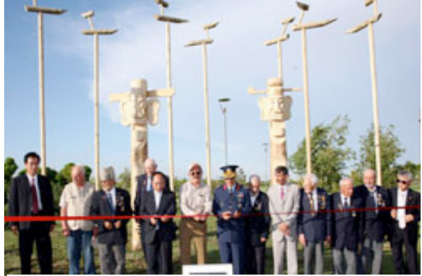
Şekil 1: Eskişehir Kent Park Sotdae ve Jang-Seung Heykelleri

alınarak toplumun birimleri olduğundan beri Sotdae bir köy koruyucusu olarak kabul edilmiştir. Sotdae kuşlarının kafalarının yönü değişkenlik gösterir. İnsanlar Sotdaeleri tarım yapabilmek için daha ılımlı bir hava veya kuzeyden direkt yağış getirmesi umidiyle diktirdiler. Bazen Sotdaelerin yüzünü, kuşların kötü ruhları alıp götürdüğüne emin olmak için köyün dışına çevirirler. Ayrıca Sotdae daha sonra, kutlama ve anma sembolü