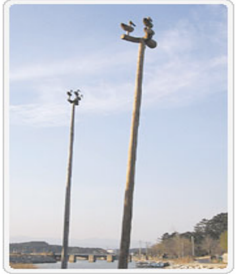
Şekil 1: ICOM 2004 Seoul Amblemi: Sotdae

Eski Türk boylarının kutsal sembollerinin hep doğan ve kartal türünden kuşlar olduğu (Ögel, 1993:593), Orta Asya Türk inanışlarında kartalın tanrı sembolü olduğu, Türk boylarının kendilerine birer yırtıcı kuşun ongun olarak seçtikleri bilinmektedir (Çal, 2011:236). Türk mitolojisine ve bu konuda yapılan alan araştırmalarına bakıldığında kuşlara ve kuş türlerine ilişkin farklı inanışlar vardır. Göktürk ve Uygurlarda kartal ve