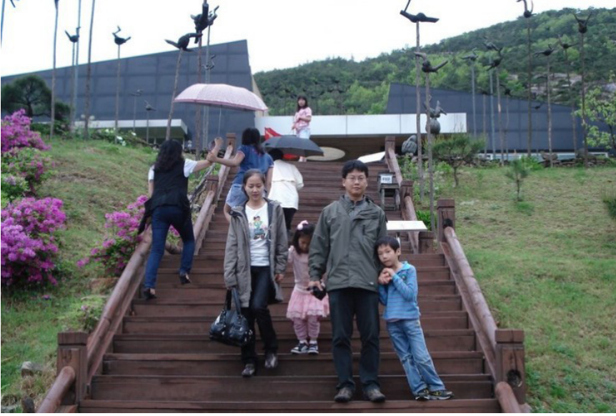
Şekil 7: Neunggang Sotdae Sanat Müzesi

( http://www.korea-fans.com/forum/konu-neunggang-sotdae-art-museum.html )