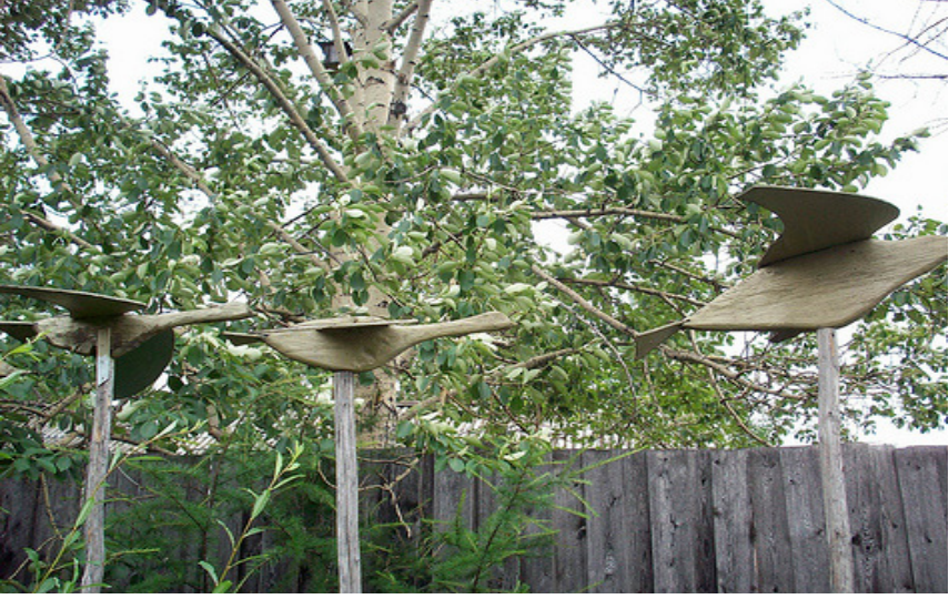
Şekil 5 Günümüzde Rusya Topraklarında Yaşayan Moğol Buryat Boyu'ndan ( http://www.turktotalwar.com/index.php?topic=2408.0 )