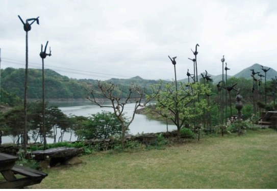
Şekil 1: Güney Kore Sotdae

Güney Kore mitolojisinde koruyucu kuş, Budizm öncesi döneme dayanır. Kuşların koruyuculuğuna ilişkin inanç Şamanizm ile ilgilidir. Bu mitolojik kuşlar efsanevi hayat ağaçlarının üzerinde bir gök tanrısını veya tanrıçasını temsil etmiştir. Kore halkı Üç Krallık (M.Ö. 57’den M.S. 668’e kadar) döneminden beri Sotdae’i inşa etmişlerdir. Güney