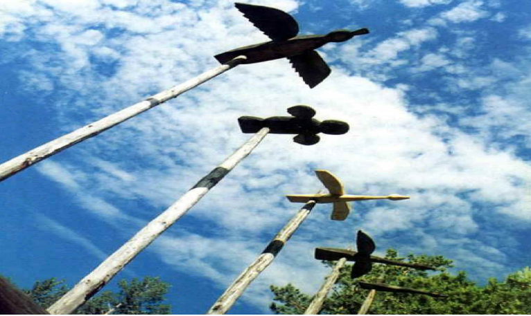
Şekil 6 Tunguz Boyu Evenkilerden ( http://www.turktotalwar.com/index.php?topic=2408.0 )