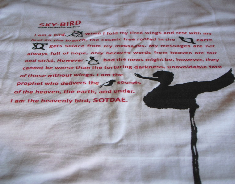
Şekil 9: Sotdae Baskılı Tişört ( http://keibooiwa.sblo.jp/article/34478562.html )