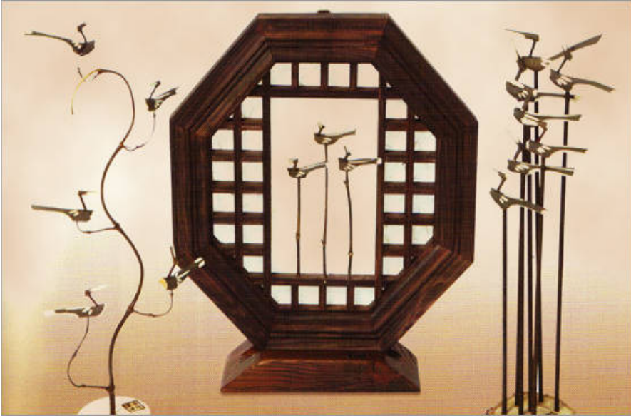
Şekil 8: Hediyelik Eşya Olarak Sotdae

( http://www.korea-fans.com/forum/konu-neunggang-sotdae-art-museum.html )