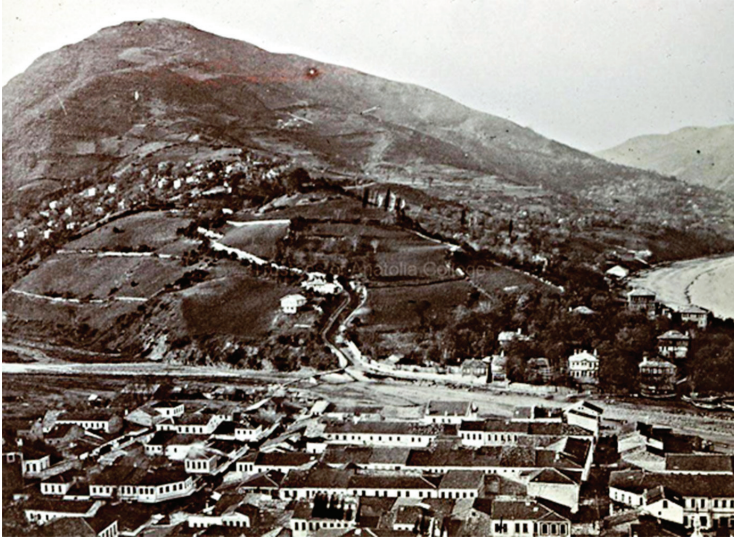
Res. 8-Abař Tepe, Kastamonu Kent M3zesi Arřivi

İnebolu'da İkiay Deresi'nin denize d3k3ld3đ3 ađızın hemen batısında Abař Baba Tepesi yer almaktadır. Burası antik Abonuteikhos/Ionopolis (İnebolu) kentinin akropol3 olarak kabul edilip 1. Derece Arkeolojik Sit olarak ilan edilmiřtir. Tepe ismini, y3re halkının kutsal saydıđı ve evliya olarak kabul ettiđi Abař Baba'dan almaktadır. Abař Baba'nın mezarının burada olduđuna inanılırken mevki bir eřit aık hava kutsal alanı olarak kullanılmıřtır.