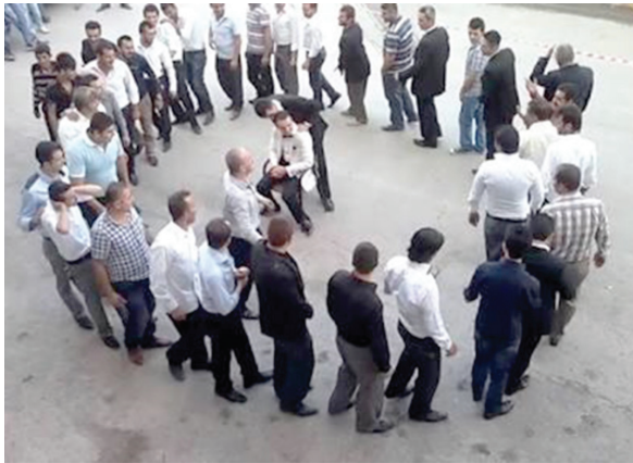
Res. 3-Tosya Heyamola Geleneđi, Mısırlı-Boylu, 1992

Helesa/Heyamola geleneğinin düğün törenleri ile ilişkisi ise Batı Karadeniz Bölgesinde Tosya Helesa oyunu (Mısırlı-Boylu, 1992: 16-17), Safranbolu’da “Halusa” oyunu (Beşe, 1935: 233-238) ile genelde Dođu Karadeniz (Hiçyılmaz, 2017) varyantlarında görölmektedir.