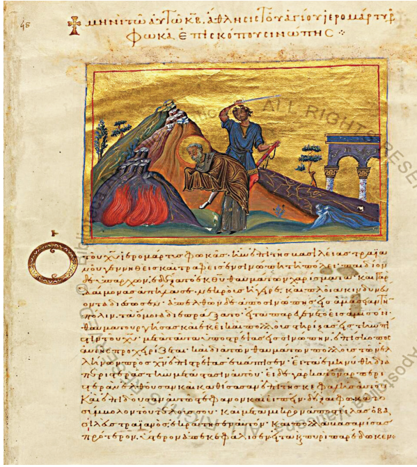
Res. 5-Aziz Phokas- http://digi.vatlib.it/view/MSS_Vat.gr.16130080 , 15.07.2021