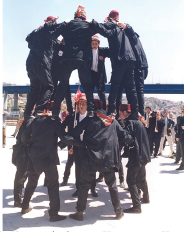
Res. 2- İnebolu Heyamola Oyunu, Kastamonu Kent Müzesi Arşivi

Helesa/Heyamola geleneğinin varyantlarında rastlanan önemli bir unsur oyunu oynayanların dolaştıkları evlerden erzak, bahşış ve yardım istemeleridir. Bunun en açık örneđi Sinop ve Gerze’de temsilen dolaştırılan tekneye toplanan yardımlarla görölrken, yine Ramazan Ayının son gecesi uygulanan Bartın’ın bazı köylerindeki uygulamalarda da görölr. Burada, ellerinde küfelerle sokaklara çıkan gençler, ev içine girmesi istenen bereket dileđi temelinde söylenen manilerini “Helesa helesa Helesa hellasa” şeklindeki nakarat kısmını hep bir ağızdan söyleyerek bahşış ve yiyecek toplarlar (Erol, 2015: 47). Tüm bu örneklerdeki ortak nokta ise bir fırtına sonrasında limana sığınan gemicilerin bu zorlu süreci atlattıklarındaki yerel halktan destek sağlamaları üzerinedir.