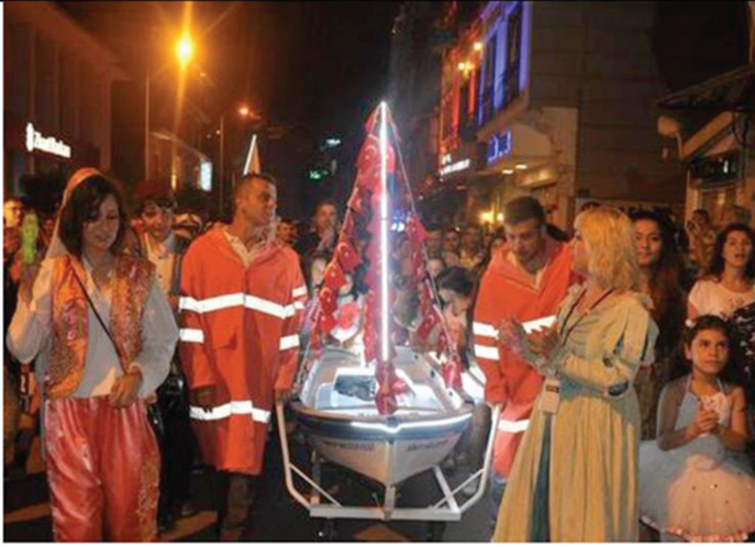
Res-1-Sinop-Helesa Geleneđi, Çek, 2015

larına hemen bir filikayı süslemelerini söylemiş. Kaptan ve tayfa süslenen bu filika ve ellerindeki fenerlerle Sinop'a inmiştir. Kentte çeşitli maniler eşliğinde dolaşp yardım toplamışlardır.” (Çek, 2015: 350)