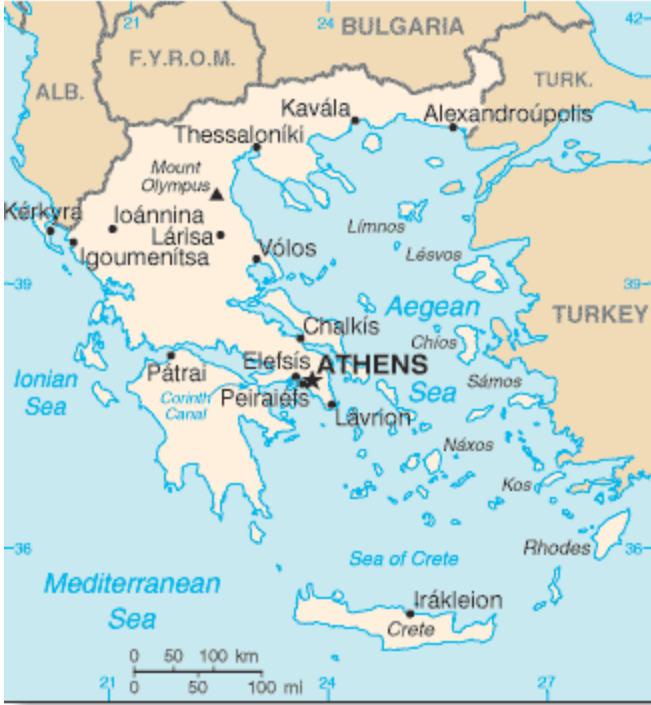
Görsel I: Yenişehir'in Haritadaki Yeri

tepede Salambria (Köstem) Nehri'nin kenarında yer alır. İpekli kumaş, kâğıt ve şeker fabrikaları başlıca sanayi kuruluşlarıdır. Yunanistan'ın milli içkisi “uzo” Yenişehir'de üretilmektedir. Osmanlı döneminde cami, medrese ve tekeleriyle devletin Avrupa'daki en büyük şehirleri arasında yer almaktaydı. Şehrin tarihi eski çağlara dek uzanmaktadır. Bursa'da yer alan Yenişehir ile karışmaması açısından buraya “Yenişehir-i Fener” ya da “Yenişehir-i Fenâr” adı verilmiştir. Günümüzde şehirde Osmanlı'dan kalan birer bedesten, câmi ve hamam olmak üzere üç yapı bulunur. Fakat bunlar da kısmen ayaktadır. Yenişehir, pek çok Osmanlı şair, âlim ve yazarının doğup büyüdüğü, yaşadığı ya da hizmet verdiği bir şehir olması açısından da önemli bir şehirdir (Kiel, 2013: 473-475).