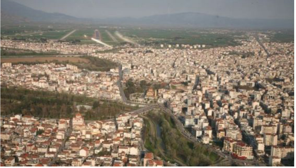
Görsel II: Yenişehir/Larissa (Bugün)