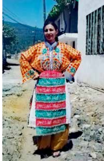
Yöresel giysilerle Güre Yaz Okulu katılımcılarından iki kişi (Güre, 2001)