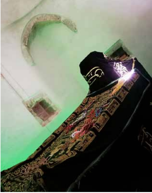
Resim 6 (Zeynel Abidin Türbesi, Zeynel Abidin'in mezarı).