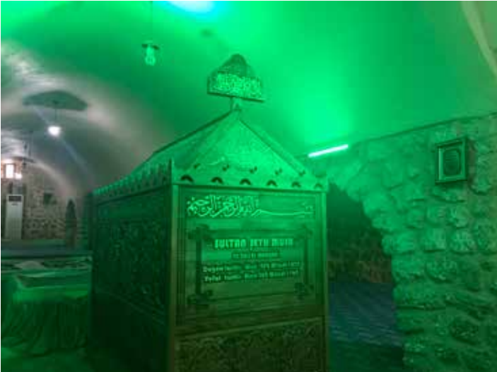
(Resim 4). (Zeynel Abidin Türbesi)