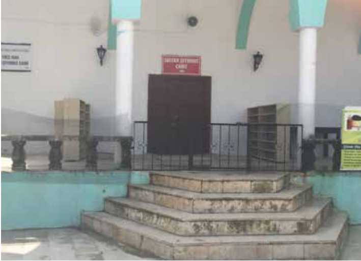
(Resim2) (Sultan Şeyhmus Camii)