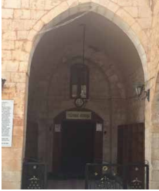
(Resim1) (Sultan Şeyhmus Türbesi Girişi)

Resimler (Diğer mekanların fotoğrafları kişisel arşivimde mevcut olup çalışmanın sınırlarını aşmamak adına fotoğraflara yer verilmemiştir)