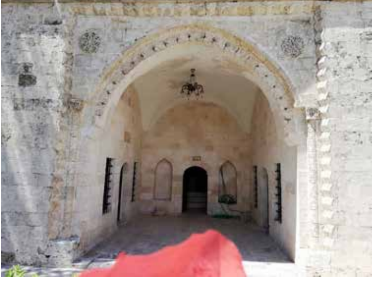
Resim 5 (Zeynel Abidin Türbesi)