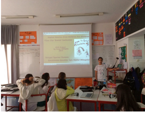
Görsel 3. Yazgı PYP projesi kapsamında dijital hikâyeleri tüm dördüncü sınıflara izlettirirken.

Dijital hikâye anlatımı atölye süreci kadar, ortaya çıkan dijital hikâyelerin içeriğine bakmak, bu yazının yürütmeye çalıştığı tartışma için anahtar bir role sahiptir. Çalışmanın bu kısmında toplam dört dakika dört saniye süren dört dijital hikâyenin dökümünü her hikâyede kullanılan bir görsel ile paylaşılacaktır.