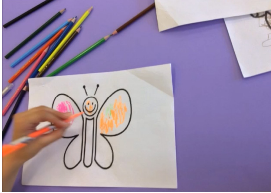
Görsel 5. Nehir'in dijital hikâyesinde kullandığı görsellerden biri

diyordum ama şimdi keşke dört güne birden gitseydim diyorum. Benim ilgilendiğim çocuğun sanki hiçbirşeyi yoktu. Neden oradaydı ki? Dokuz yaşındaydı. Ve sanırım tek büyük olan oydu. Bowling oynadık ve onları alkışladık. Bu ziyaret beni çok mutlu etmişti. Çünkü oradaki arkadaşlar bizimle vakit geçirdikleri için mutlu olmuşlardı.