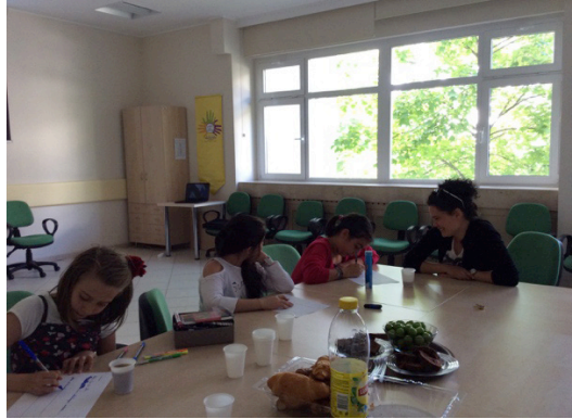
Görsel 2. Paylaşılan hikâyeler her bir katılımcı tarafından kolaylaştırıcıların desteğiyle ses kayıt için metne dökülürken.

Atölye çalışmasının ilk aşamasında hikâye çemberi aşamasına denk gelen bir uygulama yaptık. Katılımcı çocukların, Çocuk Rehabilitasyon Merkezi’nde geçirdikleri güne dair izlenimlerini paylaşmaları ile sürece başladık. Oynanan oyunlar ilk akla gelenlerdi. Daha sonra da orada ziyaret edilen çocuklarla kurulan arkadaşlıklar dile getirildi. Dijital hikâyelerinde kullanılacak görsellerin hazırlanması, çocukların deneyimlerini kağıda dökme aşamasını takip eden ses kayıt aşaması ile eş zamanlı gerçekleştirildi. Bu atölye çalışmasındaki dijital hikâyeleri çocuklar anadilleri olan Türkçe anlattılar. Daha sonra hikâyelerin atölye kolaylaştırıcılarının yardımıyla İngilizce alt yazıları yapıldı ve PYP sunumuna İngilizce olarak dâhil edildi.