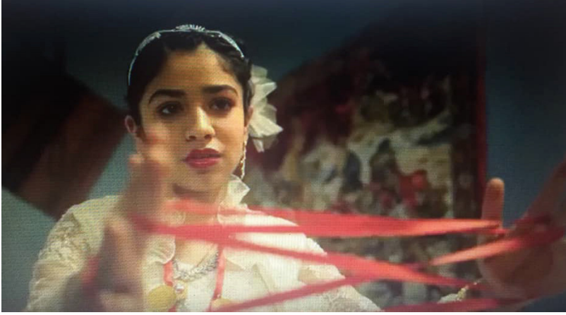
Görsel 7. Çocuk gelin temsili

Lal Gece filminde ayrıca göze çarpan bir başka nokta, sistemin karşıtlıklar üzerinden eleştirisinin yapıyor olduğudur. Örneğin filmin başlangıç sahnesinde genç bir erkeğin gelini uzaktan izleyip ardından köyü terk ettiğini görürüz. Bu bağlamda kız kendisini seven genç erkekle değil, yaşlı bir adamla evlenmeye zorlanmıştır. Yine bir başka karşıtlık çocuk gelinin yaşı ile evlendirildiği adamın yaş farkıdır ve bunu tamamlayan bir başka karşıtlık kızın şeker, yaşlı adamınsa sigara tüketmekte olduğu sahnedir (bkz. Tablo 2). Filmde yaş farkı çocuk gelinin yaşlı adama birlikte ip oynamayı önerdiği sahnede de vurgulanır (bkz.Görsel 7).