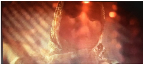
Görsel 4. Duvak 1

Görsel 4 ve Görsel 5 yukarıda sözü edilen kırmızı örtüyü göstermektedir.