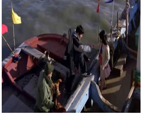
Görsel 11. Genç Erkeğin Tekneye Gelişi

Kore’de kadınlar bir yandan Konfüçyüsçü kültürel miraslarıyla mücadele etmekte, bir yandan da kendi cinsel öznelliklerini arama derdindedirler. Güney Kore’de 1995 yılında cinsel kimlik ve cinsel öznellik meseleleri üniversitelerde tartışılan önemli meseleler haline gelmiştir. (Kendall, 2002: 141-142). Hwal (Yay, Kim Ki Duk, 2005) filmine toplumsal cinsiyet eşitliği bağlamında bakılırsa, kadın cinsel kimliğinin farkında değildir. Cinsel kimliğinin farkına ancak bir erkek sayesinde, yani tekneye gelen genç erkek karakter aracılığıyla farkına varır ve bu farkındalık kendi özgürlüğünü arayışına neden olur.