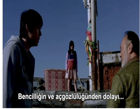
Görsel 19. Tartışma

Genç kıza hiç bir şekilde ne istediği sorulmamakta, kadının kaderini erkek belirlemektedir (bknz., Görsel 12). Filmin son sahnesinde de yaşlı adam yani kadının kaderini belirleyen erkek intihar ederek kadını terk etmiş gibi görünse de sembolik olarak ona sahip olmuştur. Yani bu sahnede yine erkek kadının sahibidir. Kendi kaderini ancak erkek isterse belirlemekte ve kendi özgürlüğüne ancak erkek isterse kavuşabilmektedir.