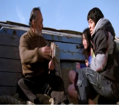
Görsel 22. Şiddet sahnesi