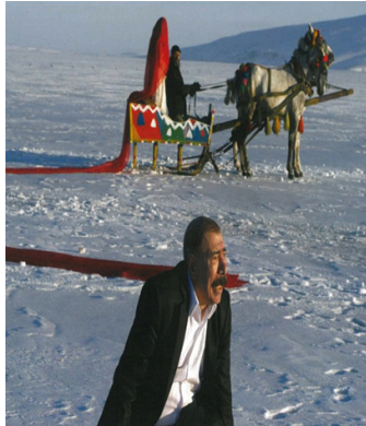
Görsel 6. Rüya sahnesi