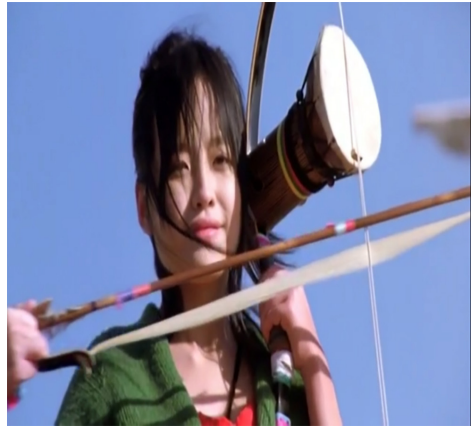
Görsel 17. Geleneksel enstrüman