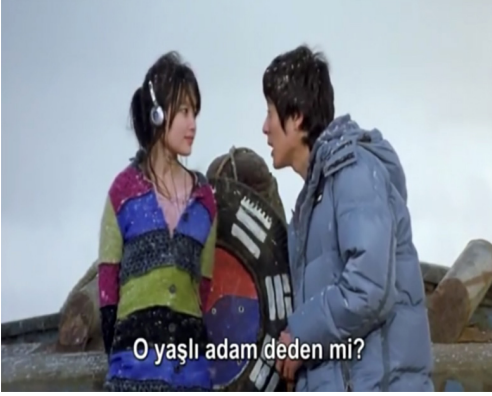
Görsel 10. Tanışma