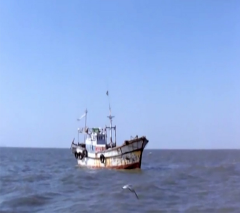
Görsel 8. Tekne

Görsel 8 tekneyi göstermektedir. Görsel 9 ise genç kızın yay kullandığı görseli içermektedir.