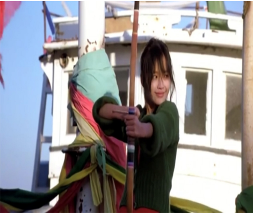
Görsel 16. Genç kız ve Yay

Görsel 16 ve Görsel 17 durumu göstermektedir.