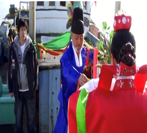
Görsel 24. Düğün sahnesi

Görsel 24 ve Görsel 25 Düğün sahnesini göstermektedir.