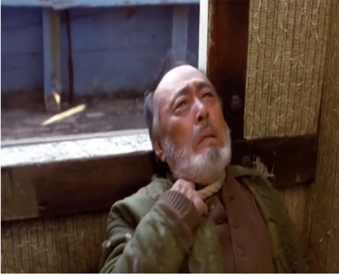
Görsel 20. Yaşlı adam intihar sahnesi

Görsel 20 ve Görsel 21 durumu göstermektedir.