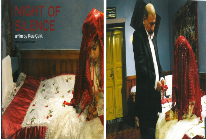
Görsel 1. Lal Gece (2016) Görsel 2. Gerdek Odası

Görsel 1 ve Görsel 2 söz konusu durumu göstermektedir.