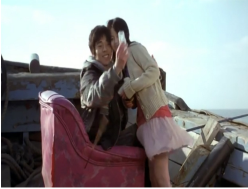
Görsel 18. Yakınlaşma

Görsel 18 ve Görsel 19 durumu göstermektedir