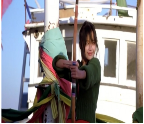
Görsel 9. Yay

Film, dünyanın çeşitli yerlerinde yaşanan “çocuk gelin” gerçeğini sıra dışı bir bakış açısıyla izleyiciye sunmaktadır. Filmde, ailesinden koparılmış olan genç kıızı yedi yaşındayken alıkoyup, ona kol kanat geren ve her şeyden koruyan yaşlı adamın, genç kızla evlenmek için onun reşit olmasını beklemesi ve hazırlık yapması bencilce bir tutku olarak aktarılmıştır.