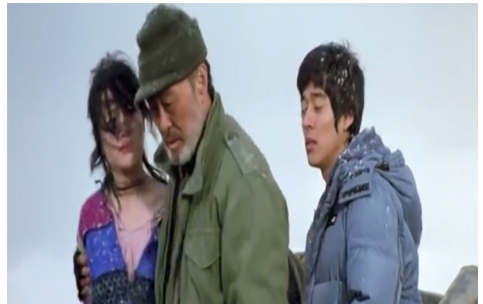
Görsel 13. Yaşlı erkek-geç erkek