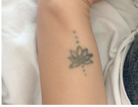
Şekil 1. Kişisel bir hikâye-lotus çiçeği

Koruyuculuk özelliğinin olduğuna inanılması: İnsan, kutsiyet atfettiği şeyin bir parçasını yanında taşıyarak simgeleştirir, bu şekilde onu yanında hisseder. Bu özelliği ile dövme, taşıyıcısını zararlardan ve kötülüklerden koruyan bir tılsım olarak görülmektedir.