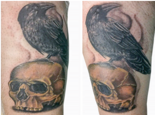
Şekil 5. Aykırılığı ve korkusuzluğu simgeleyen kuru kafa ve kuzgun dövmesi

Dövme her şeyden önce özgürlükçü yaşamı temsil eder. Kaç tane dövmem var hiç saymadım, ama oldukça fazla [...]. İlk dövmem silahları sevdiğim için silah dövmeleri yaptırдыm. Kuzgun dövmem aykırılığı, başkaldırıyı simgeler. Genellikle anarşistler ve ateistler kuzgun dövmesini yaptırır. Gerçi ben ateist değilim, inançlı bir insanım. Üçgen içindeki tek göz dövme sembolü en çok bana sorulan dövmem. Aslında tek göz dövme simgesi şaman inancından geliyor. Şamanlar alınlarına ve göğüslerinin ortasına tek göz simgesi yaptırırılar. Bunun ikinci bir ruhu temsil ettiğini söylerler. Benim içinde öyle diyebiliriz. (K7)