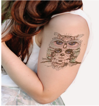
Şekil 2. İnancı gereği yapılan baykuş dövmesi

İlk yaptırdığım dövme merakımdan, özentiden ve hoş görüdüğümü düşündüğüm için yaptırdım. Sonradan anlamlı olan, benim için simge oluşturan şeyleri vücudumda taşımak istedim. Örneğin ben şaman inancına sahibim ve şaman inancının sembollerinden olan baykuşu sol koluma ve şaman rahip görselini de göğsüme yaptırdım. Tüm bunları inancımın bir gereği olarak görüyorum ve beni kötülüklerden koruduğuna inanıyorum. (K4)