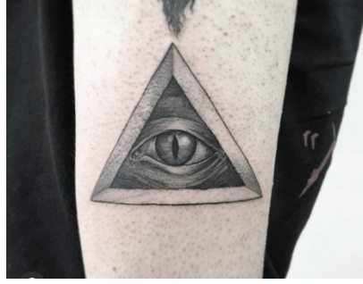
Şekil 6. İkinci bir ruhu temsil ettiğine inanılan tek göz dövmesi

Bir aidiyet göstergesi ve iletişim biçimi olarak dövme: Kimliğin diğer bir özelliği bireyin bir topluluğa aitlik hissiyle bağlı olmasıdır. Kimliğin sosyal-kültürel boyutunu oluşturan aidiyet duygusu, kişinin sosyalleşme sürecinin bir gereği olarak diğer kişiler ile ortak düşünceler etrafında bir araya gelmesidir.