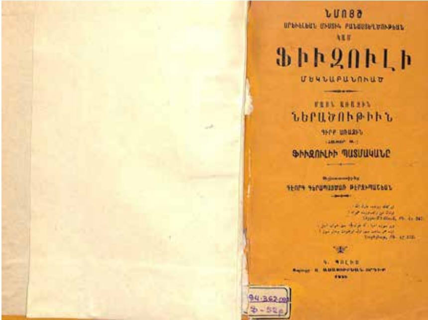
Resim 1: Kitabın Ermenice kapağı