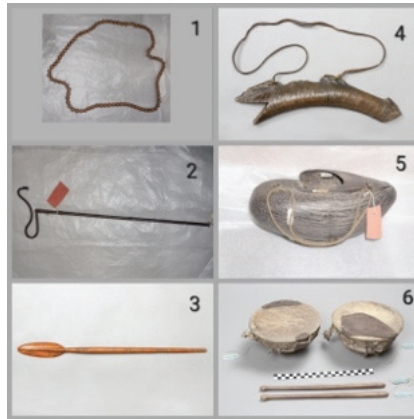
Görsel 8. 1. Tespih, 2. Asa, 3. Asa, 4. Boynuz, 5. Keşkül, 6. Kudüm (Nakkare) https://goskatalog.ru