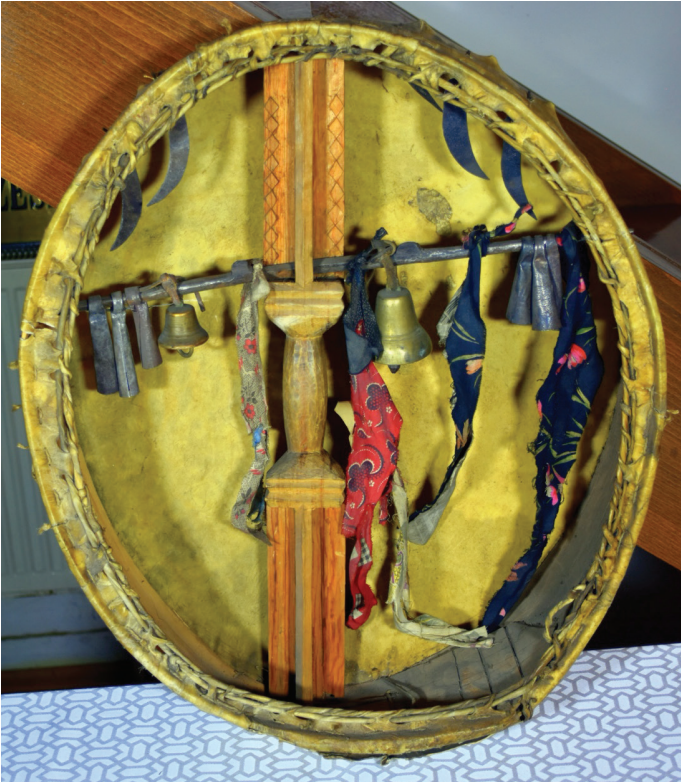
Görsel 14. Davulun arka tarafı

Katanov çanların şamanın dua etmesine yardımcı olduğunu yazmıştır (1907: 551). Koni şeklindeki süngülerinin ses çıkarması İrlık Han’a, çan ve zil sesleri ise dağ ruhuna seslenildiği anlamına geliyordu (Butanaev, 2006: 92).