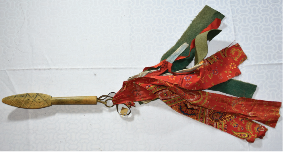
Görsel 16. Davulun tokmağı

Sonuçlara gelmeden önce, tokmak (“orba”) hakkında birkaç söz söylemek gerekmektedir. Tokmak ve davulun orijinal anlamı birleşiktir. Tokmağın davulda vücut bulan hayvanın bir parçası olduğu düşünülür (Basilov, 1984: 94). Bu nedenle birçok şamanist geleneğe ge-yik boynuzundan bir tokmak yapmak adettendir (Basilov, 1984: 95). Hakas geleneklerinde tokmak huş ağacından yapılır. Zamanla davulun şamanın binek hayvanı olduğu fikri yerleşmiş, tokmak şamanın mucizevi atını hızlandıran bir kırbaç hâline gelmiştir (Basilov, 1984: 95; Prokofyeva, 1961: 446). Eğer şaman öteki dünyaya giden fantastik bir nehir boyunca yelken açmak zorunda kalırsa, davul bir kayak olarak algılanır ve tokmak bir küreğe dönüşür (İvanov, 1955: 186).