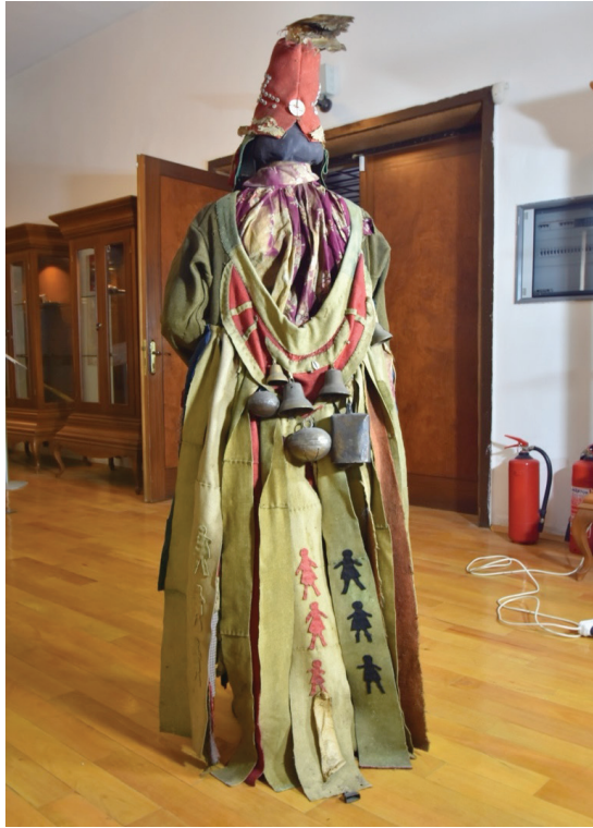
Görsel 11. Kostümün arka kısmı

Büyük çanların (“hongro”) ne anlama geldiğinin açıklanması gerekmektedir. Butanayev, bu kelimenin Moğol dilinden ödünç alındığını, burada “honh” çan, zil anlamına geldiğini düşünmektedir (2006: 78). Prokofyeva'ya göre çanlar ruhları çağırmaya ve sevindirmeye hizmet ediyordu (1971: 64). Ancak bunun tam tersi bir işlevi de vardı: “Çan sesleri kötü güçleri korkutur ve sahibini diğer şamanların kötü niyetlerinden korurdu” (Butanayev, 2006: 78; Mazay, 2013: 88).