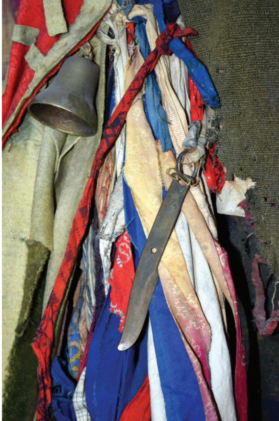
Görsel 12. Kostümün arka kısmının fragmanı

Kurdelelerin sayılması sırasında ilginç bir ayrıntıyı ortaya çıkmıştır: Ceketin içine küçük bir bıçak gizlenmişti (Görsel 12). Giysinin, şamanın askerî kıyafeti olduğunu hatırlatmak gerekir, içinde çeşitli silahlar şeklindeki metal parçalara sıkça rastlanır. Kostümün harap olması, ipliklerin çürümesi ve dikilmiş ağır objelerin düşmesi nedeniyle metal eşyaların bir kısmının kaybolduğu ihtimali akla gelmektedir.