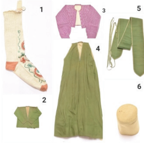
Görsel 7. 1. Çorap, 2. Yelek, 3. Yelek, 4. Tennure, 5. Elif Nemed, 6. Sikke (Derviş Başlığı)

Mészáros'un şaman mankenin Türkiye'ye getirilmesinde etkili olduğu varsayımı, Mészáros'un 1922'den beri REM'de Kafkasya ve Orta Asya Bölümünün küratörü olarak çalışan ünlü Sovyet Türkolog Alexander Samoyloviç ile tanışıyor olmasıyla da desteklenmektedir. İşte 27 Eylül 1925 tarihli bir Samoyloviç'in mektubundan bir alıntı: "Profesör Mészáros, Halk Eğitim Bakanlığı Dergisi'nde Ankara'da bir etnografya müzesi kurulmasına ilişkin bir proje yayınladı. Müze henüz mevcut olmamasına rağmen, kendisi hâlihazırda müzenin müdürüdür. Benimle yaptığı görüşmeden sonra Mészáros bize gelmeye hevesli" (Blagova, 2008: 155). Elde doğrudan bir kanıt olmamasına rağmen bir akademisyenin başka bir akademisyenden müzenin düzenlenmesi konusunda yardım istediği varsayılabilir. Ek olarak o yıllarda Türkiye ve SSCB'deki etnografya müzeleri arasında müze koleksiyonlarının değiş-tokuş edilmesinden söz ediliyordu (Yusupova, 2024: 88).