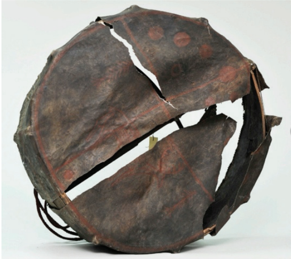
Görsel 13. Sayan davulu (Biçeldey, 2019: 155)

Öncelikle Rusya müzelerinde yetmiş kadar Hakas davulunun bulunduğunu belirtmek gerekir (İvanov, 1955: 180). 1955'te envanteri hazırlayan İvanov, birçok davulun üzerindeki çizimlerin önemli ölçüde zarar gördüğünü ya da silindiğini belirtmiştir. Gerçekten, özellikle orta kısımda, davulun darbeler yüzünden boyası silinmiş ya da parçalanmıştır. Şaman, davulu müzeye gönüllü olarak verdiğinde, onu "ritüel olarak öldürmek" zorunda olduğunu da eklemek gerekir. Davul, içindeki ruhları serbest bırakmak için bir bıçakla kesilmektedir (Müzeye vermeden önce tüm şamanlar genelde bu kesim işini yapmak zorundadır). Görsel 13'te de görülebileceği gibi, bu tür davulların üzerindeki çizimleri ayırt etmek çok zordur. DTCF'deki davul hiçbir zaman kamlama için kullanılmamıştır. Üzerindeki çizimlerin en küçük ayrıntılarının bile korunması, bu davulun analiz edilmesi için çok uygun olduğu anlamına gelmektedir.