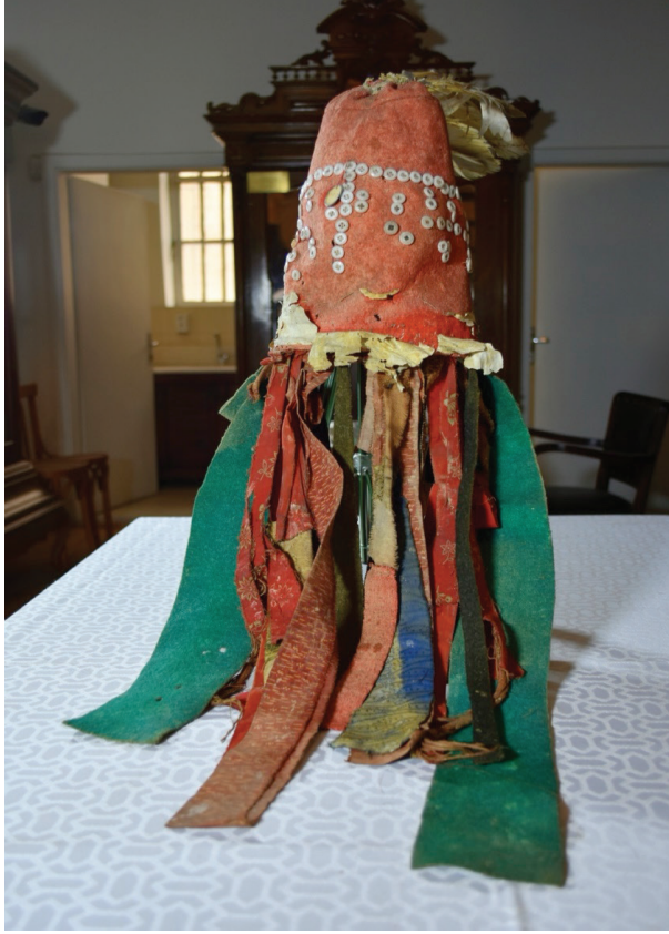
Görsel 9. Şaman başlığı

Şamanın kıyafeti ya bir kuş ya da bir hayvan olarak temsil edilir. DTCF'deki mankende başlığın tepesinde yaklaşık 30 cm yüksekliğinde dikili duran bir puhu kuşu kuyruğu (“çalaa”) tüyü vardır. Hakas Şamanizmi'nde puhu kuşu sıklıkla tercih edilen bir kuştur. Baykuş ya da puhu kuşu gececi, karanlık bir kuştur (Prokofyeva, 1971: 7). Dolayısıyla şaman, bu başlığını alt dünyaya seyahat etmek için kullanmaktadır.