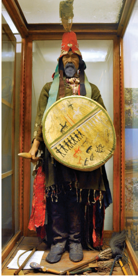
Görsel 10. Vitrinde şaman başlığının yanlış duruşu

kıyafetleri ve davulu dikkatle inceledikten sonra, mankeni vitrine geri koymadan önce başlığı olması gerektiği gibi takılmıştır (Görsel 1).