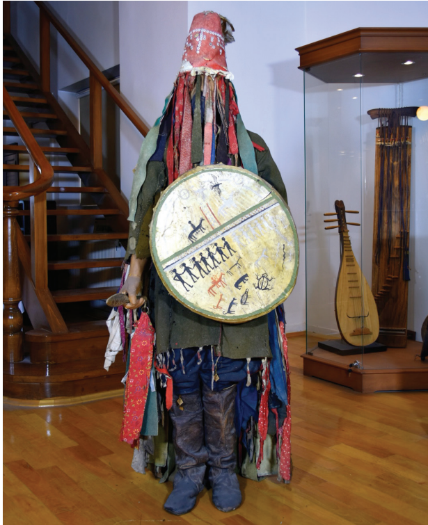
Görsel 1. DTCF Sergi Salonu'nda davulu elinde şaman mankeni

Ankara Üniversitesi Dil ve Tarih-Coğrafya Fakültesi (DTCF) Sergi Salonu'nda sıra dışı bir obje bulunmaktadır. Bir şaman mankeni, kafasında bir şaman başlığı, üzerinde bir şaman kıyafeti, elinde bir şaman davulu ve bir şaman tokmağı ile bu salonda sergilenmektedir (Görsel 1). Bu şaman mankenin, özel koleksiyonlar hariç, Türkiye'deki tek özgün şaman kıyafetini ve davulunu sergilediği varsayılmaktadır.