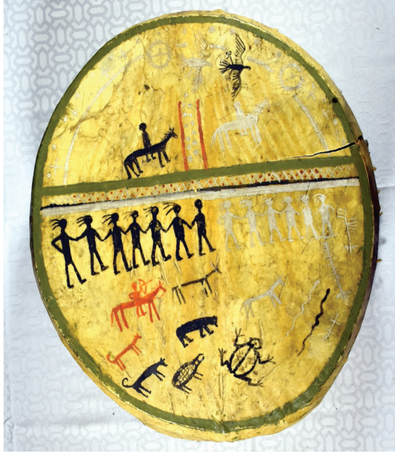
Görsel 15. Davulun ön tarafı