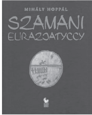
Görsel 3. “Avrasya Şamanları” adlı kitabın kapağı (Hoppal, 2009)

Ünlü Macar araştırmacısı Mihaly Hoppal, DTCF’yi 1999 ve 2016 yıllarında iki kez ziyaret etmiştir. Hoppal, ilk ziyaretinde o zaman G-6 numaralı odada sergilenen şaman mankenini görmüş ve farklı açılardan çeşitli fotoğraflar çekmiştir. Araştırmacı, DTCF’deki şaman davuluna o kadar ilgi duymuştur ki 2009 yılında Avrasya Şamanları adlı kitabının kapağına davulun bir fotoğrafını koymuştur (Görsel 3).